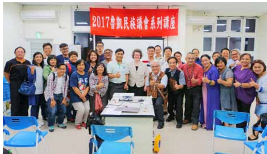
2017年5月22日魯凱族民族議會舉辦系列講座第一場次會後合照。

民族議會是一個能夠讓同胞相互連結、溝通協調的一個平台機制。對外，則是在法規條文與體制內找到最大公約數，面對如高牆般的政府體制，我認為現行的法律當中一定能夠找到共治、共管、共享的實際作為。