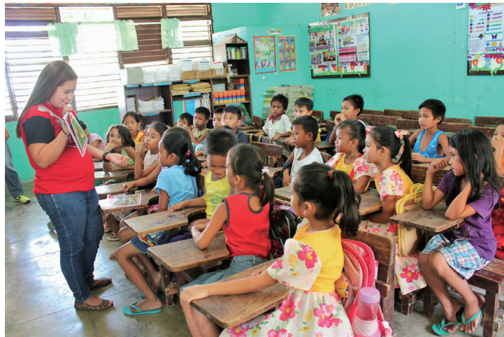
Salto的培育人員於Cebu的小學進行教學。

體。民族的多樣性，反映在2010年的全國人口統計問卷裡，當時列有182個民族（ethnic groups）。