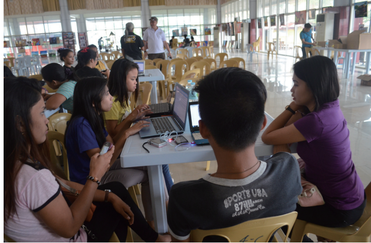
舉辦撰寫Waray語的維基百科會場。

在菲律賓，「文化少數民族」（ethnocultural minorities）通常指涉因各種歷史因素，而未受到主體基督宗教文化同化的群