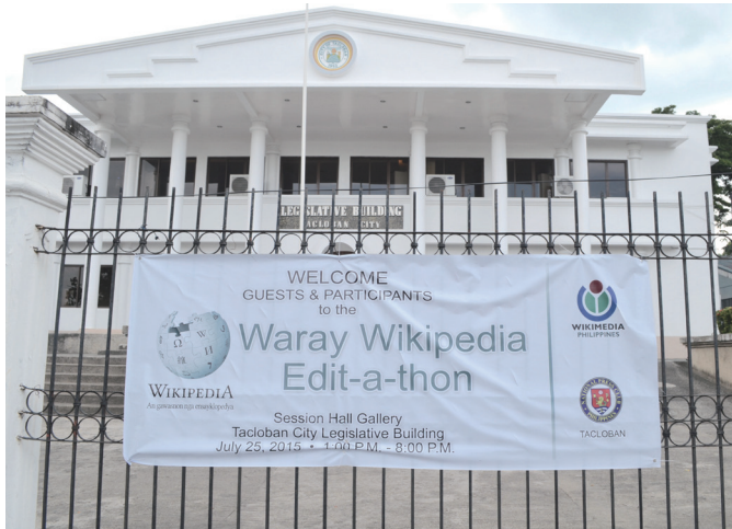
Waray語的維基百科撰寫會場。

1978 年開始，學校將菲律賓語視為「國語」來實施教學，目前已普遍通行。另一種共通語言－英語，全國人民從幼稚園就開始學習英語，幾乎人人均具備英語口語及書寫能力，官方文書與大眾媒體多以英語為主，然而近年來本土意識抬頭，越來越多人喜歡使用本族語言，年輕一輩的英語水準已遠不如前，尤其是偏鄉地區。而西班牙語過去屬於較高社會階層的常用語言，直到 1970 年代，國家教育法修訂後，才將西班牙語從中學及大學的必修課程裡刪除。