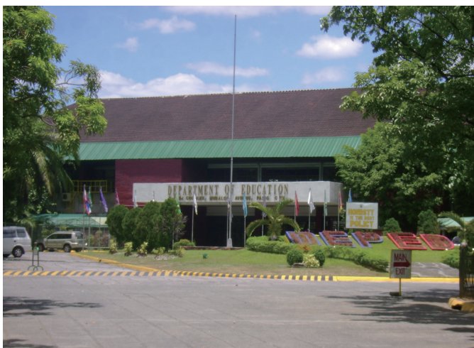
位於馬尼拉大都會帕西格市（Pasig city）的菲律賓教育部。