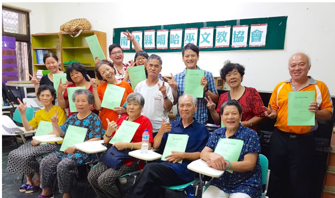
噶哈巫語種子教師期待站上講臺的那天。

噶哈巫語 師資培訓班為原民會105年度平埔族群語言復振計畫子計畫之一，由南投縣噶哈巫文教協會主辦。培訓時數共計36小時，涵蓋「族語教學」、「教材教法」、「教學觀摩」、「教學演示」四大課程，聘請專業師資授課，培育噶哈巫語種子教師。