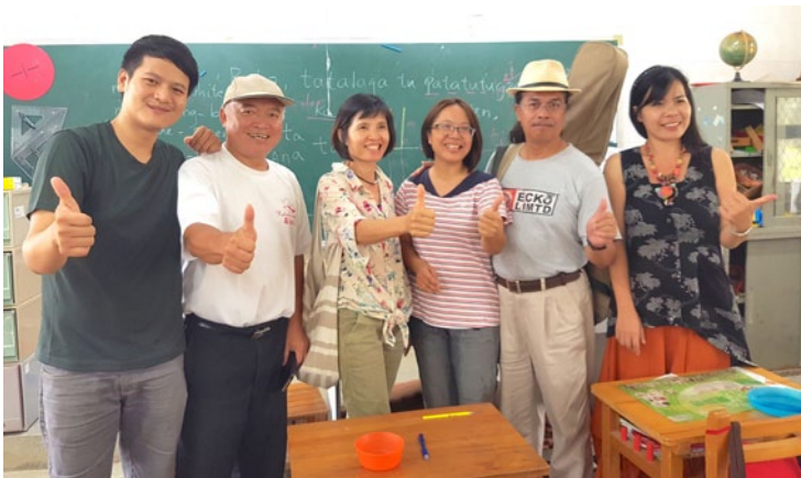
學員遠赴西拉雅族取經，觀摩口碑國小族語教學。

升學員的族語能力與教學能力。邀請資深族語教師蒞臨授課、帶領學員教學觀摩也是噶哈巫族第一次的嘗試。本班培育了十餘名種子教師，未來有機會擔任生活會話班教師、國小教師、族語營教師。