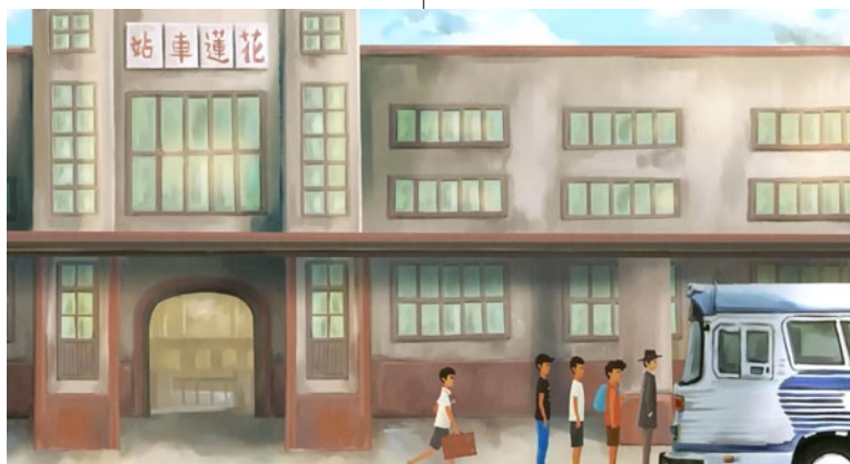
相遇在花蓮車站，踏上尋找夢想的旅程。

到了1960年這個年代，許多的花東青年們開始陸續北上，想前往當時十分繁榮的台北工作打拼，追求更好的生活，從此踏上未知的旅程。接下來的故事，主要聚焦在幾位花東的年輕人身上，他們懷抱著各自的夢想，在前往台北的