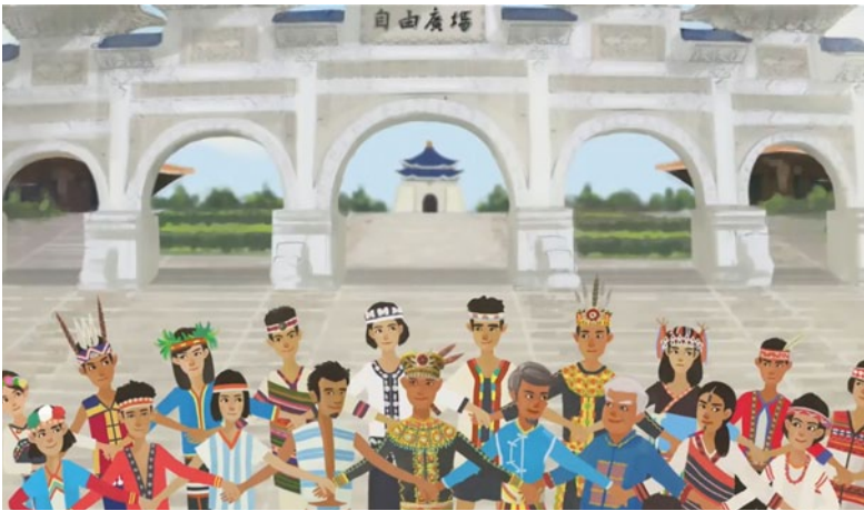
今天，明天，永遠，都要唱自己的歌。