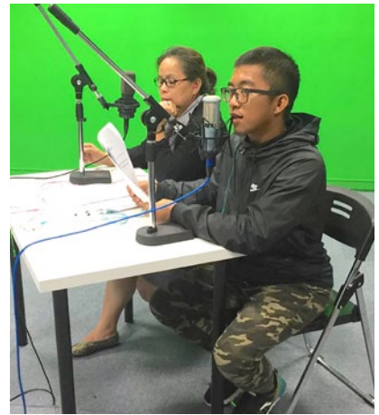
學員們正在錄製配音班期末成品「台北·不流浪」。

人。從完全不會說族語，到能夠順暢地說出分配到的台詞。這些改變不是馬上就能學會的簡單事情，都是經過學員們認真的學習、及無數的練習才能擁有的成果。