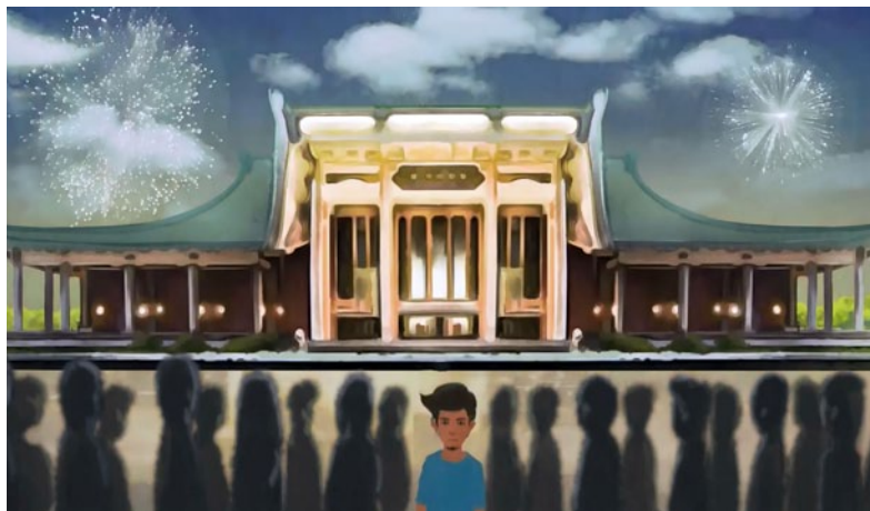
燦爛的煙火，點點落成角落裡的我們。

延續到今天，我們應該都一直秉持著同樣的信念，努力保存原住民族的傳統及語言，並讓原住民的文化發揚光大，也因此我們舉辦了第一屆的台北市族語配音人才培訓班，希望這幾代的原住民青年們，也能夠傳承自身的傳統文化、學習自己的族語，並且結合專業的配音技能，培養更多元廣泛的興趣，創造更多的就業機會。