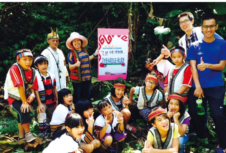
學生著傳統服飾，尋訪部落舊址。

我們決定在學校現有的課程架構下，發展以在地泰雅族民族教育為主體的本位課程，透過學校師生、家長及社區部落的共同決定與實施，研發與孩子生活經驗、環境息息相關的在地生活化教材，讓孩子「有感覺、展自信」。