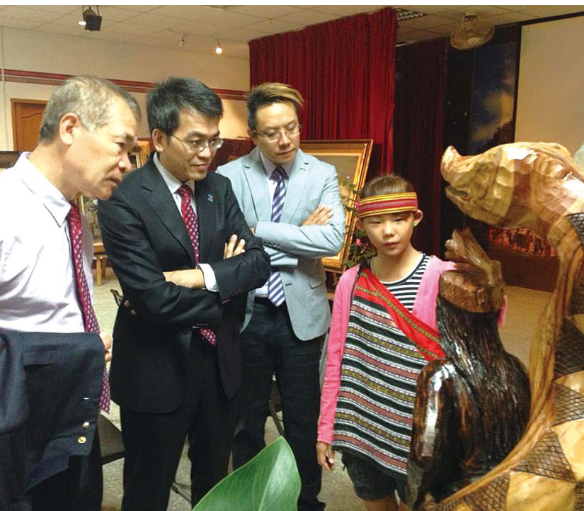
學生向外賓導覽傳統文化。