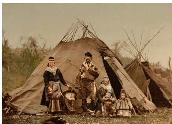
薩米人是北歐地區的原住民，歐洲最大的原住民族群之一，也是歐洲目前僅存的遊牧民族。

們。由於熊對庫薩莫地區的薩米人而言是神聖的動物，他們並不會輕易的獵捕熊，只有當獵人發現熊在太靠近村莊的地方築巢時，才會獵捕他們，並且在獵捕熊的過程中共同舉行一項盛大的慶祝儀式。至於水獺，則是因為數量太稀少，所以為了避免他們滅絕，才採取集體獵捕的方式。