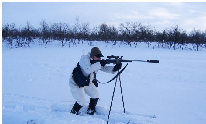
狩獵從過去就是芬蘭的重要經濟活動，發展至今成為芬蘭人的休閒娛樂，只要經過考試跟申請，就可以合法狩獵。

和台灣不同，芬蘭的狩獵活動並非原住民特有的文化行為，基本上只要通過相關申請規定和考試，任何芬蘭民眾都可以享有狩獵的權利。由於芬蘭的氣候環境不適合發展農業，因此採集和狩獵一直都是芬蘭很重要的傳統經濟活動，而這項狩獵的傳統延續至今日，便成為芬蘭人的休閒娛樂之一。對愛好狩獵的芬蘭人來說，花費時間待在森林裡捕捉動物的身影，並不是什麼觀光的噱頭，而是實際參與到大自然之中的文化活動。透過狩獵，芬蘭獵人能夠獲得額外的肉類供自己食用或者轉賣給其他需要的人，而狩獵在芬蘭社會普遍受到尊重的另一項原因，則是因為獵人會向相關單位登記捕獲到的獵物，幫助國家統計野生動物的數量，進而確保維