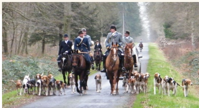
法國最古老的狩獵方式——獵犬狩獵。

每個聯盟亦提供建立在實作和尊重環境的培育課程上。選擇狩獵哪種動物和狩獵方法是有限制的。這就是為什麼這些培訓在於引導獵人遵守安全規則，協助使用槍火設備，特別是學習做一個負責任的獵人。並不是一定要藉由這些培訓才可以通過，也可