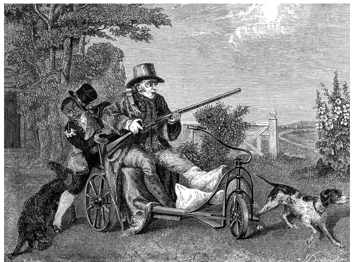
Buss的畫作「開獵」 (L'ouverture de la Chasse)。

De nos jours, ce sont sept millions de pratiquants en Europe dont plus d'un million en France. La chasse est le deuxième loisir favori des français derrière le football. C'est