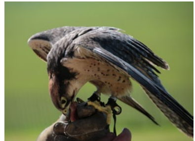
藉由訓練猛禽來協助狩獵的比例較少，約占法國狩獵活動的1%。

un art de vivre pratiqué à 95% par des hommes, dont la majorité est âgée de 55 à 64 ans. C'est une activité conviviale rassemblant famille et amis pendant le weekend. La principale raison de chasser est le fait d'être en contact avec la nature tout en respectant son environnement et ses habitats.