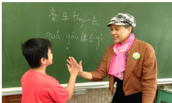
設計「牽牛回去」創意教學法，輔助學童學習發出台語g音。

我希望台語能恢復活力，不再聽到小孩因為g音消失講出奇怪的台語，像是憨憨（gōng gōng）變成旺旺（ōng ōng）、囡仔（gín-á）變成印仔（ìn-á），實在是「一丈差九尺」呢！有人說：「工作是給想做的人做的，不是給能力強的人做的。」我是想做的人，我的熱情就像一把火，慢慢地燒出一朵花，無怨無悔堅持繼續走母語文字化這條路。◆