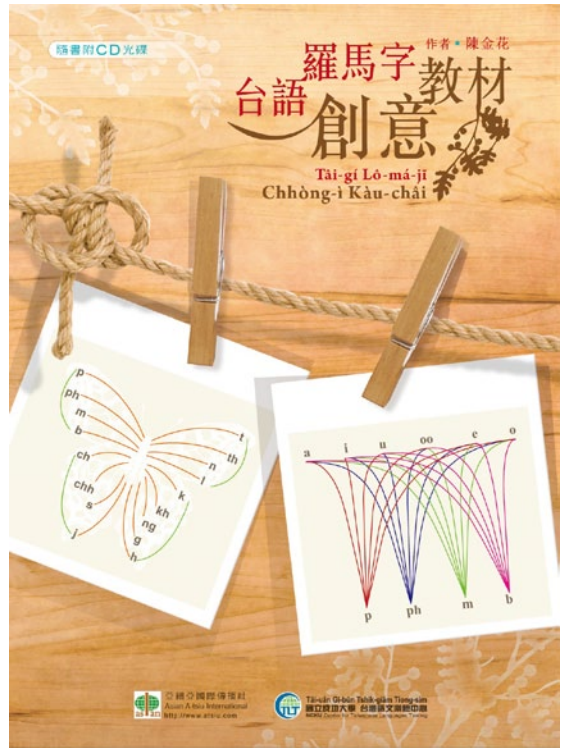
筆者將過去的研發、教學成果集結出版《台語羅馬字創意教材》。

員目標是通過成大台語認證B2，鼓勵參加師資 培訓去學校教台語，到今也培訓74位台語老師 ah！