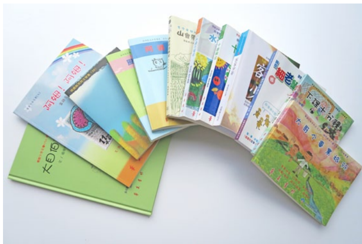
筆者熱衷客語文學創作，童話、散文、小說及新詩等皆有涉獵，圖為筆者部分出版著作。

典，「萬丈高樓愛從底起」，這兜恁責恁大本个客話字典，絕對毋係一年兩年就有辦法完成个，其實係母語被禁个年代，早就從台灣南南北北，當多毋甘願看等客話沒落个有心人士手上，毋畏辛苦、毋驚無市場，只為著對母語傳承責任盡一份義務，就一個一個以個人之力恬恬仔完成矣。