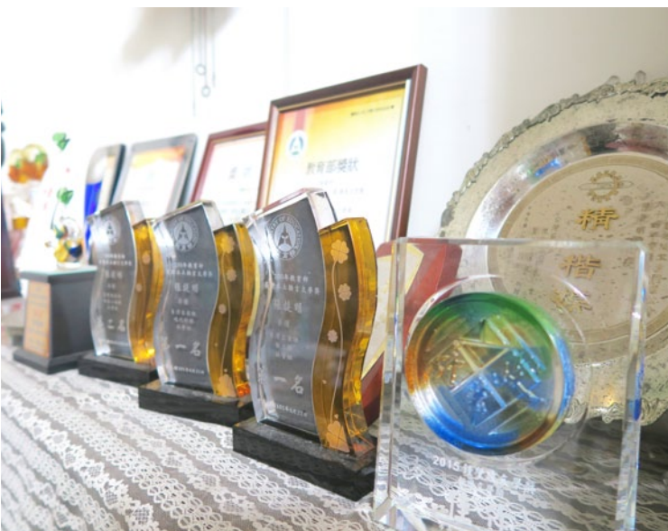
過去參加各類客家文學比賽獲得的榮譽。

伯公是讀書人，還當過鄉長，我在他的書架上看到一本一本薄薄的書，不是小孩子喜歡讀的漫畫書喔，那是介紹客家的雜誌《苗友週刊》。我掀開來看，裡面有很多大人唱的歌家山歌歌詞，客家山歌非常淺顯，大人小孩都聽得懂，那書中歌詞就是用客家話寫的。