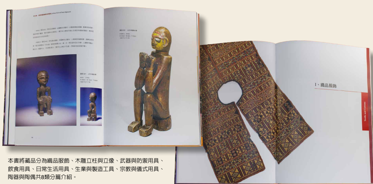
本書將藏品分為織品服飾、木雕立柱與立像、武器與防禦用具、飲食用具、日常生活用具、生業與製造工具、宗教與儀式用具、陶器與陶偶共8類分篇介紹。