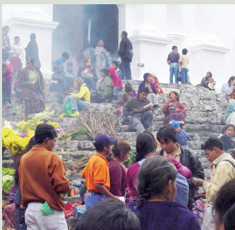
現代基切—馬雅族的市集。

其他：有豐富的文學與史學文獻，例如史詩《波波爾·烏》（ Popol Vuh ）。