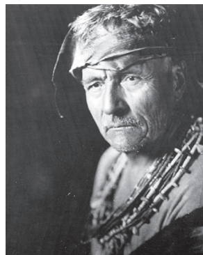
Henry Chee Dodge為納瓦霍民族議會第一屆主席。