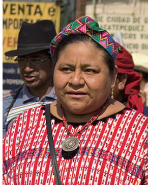
Rigoberta Menchú Tum為第一個獲頒諾貝爾和平獎的美洲原住民。

1992年，因爭取瓜地馬拉原住民族權益與社會公義，成為第一個獲頒諾貝爾和平獎的美洲原住民。1998年，獲阿斯圖里亞斯親王獎。1984年，其自傳《 I, Rigoberta Menchu 》闡述瓜地馬拉內戰（1960年起）過程中，原住民族受到迫害的處境。是瓜地馬拉本土政黨的政治代表，曾於2007年與2011年競選瓜地馬拉總統，為原住民族權益發聲。現為聯合國教科文組織的親善大使。