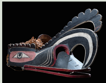
瓜求圖族的食人鳥面具。