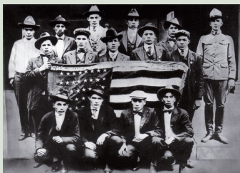
恰克圖族人於第一次世界大戰時受訓成為電台及電報通訊員。

教育：族語學校Chahta Anumpa Aikhvna（School of Choctaw Language），提供民族語言、歷史、文化等課程，各部落政府也設立了部落學校。