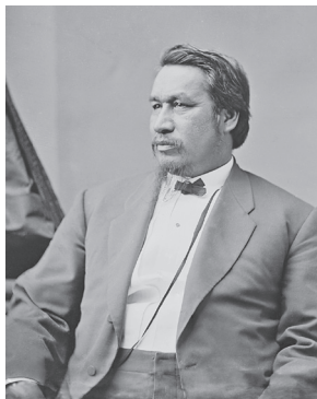
Ely s. Parker為第一位擔任印第安事務局局長的原住民。

曾攻讀法律，卻因印第安人不具美國公民身分而無法進入法庭任職。1851年，他與人類學者摩爾根（Lewis H.