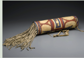
黑腳族的頭飾（布魯克林博物館收藏）。

族的權益。他在去世的前幾年，於該族的聲望提高；1978年，一群新的大樓以他的名字命名。其他榮譽事蹟包括：1957年獲全美印第安人獎，1961年獲選為傑出美國原住民，1966年榮登奧克拉荷馬州名人堂。