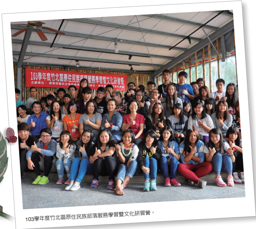
103學年度竹北區原住民族部落服務學習暨文化研習營。

課程中學習本族文化，深耕民族文化教育。依據本校原住民族學生各族人口比例，累計共開設6個族語班，分別為阿美語、泰雅語、賽德克語、排灣語、布農語、太魯閣語。