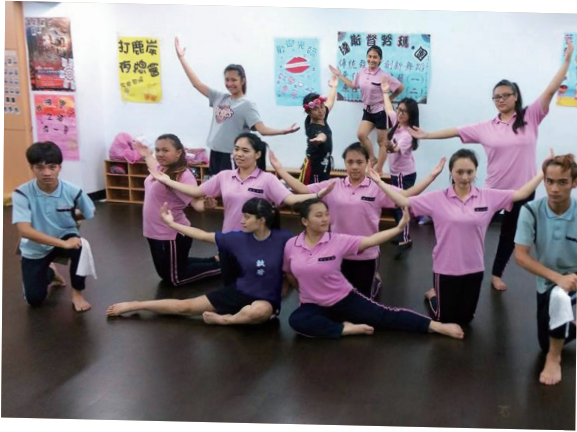
「達斯督努瑪·團」練舞畫面。