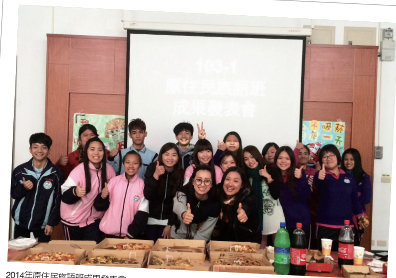
2014年原住民族語班成果發表會。

依據本校組織規程，「原住民教育發展中心」為本校發展重點特色之一。中心置主任一人，由校長遴聘助理教授以