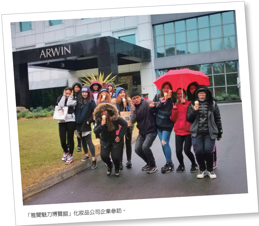
「雅聞魅力博覽館」化妝品公司企業參訪。

能檢定培訓課程，輔導原住民族學生在學期間考取相關技能證照，提升職場就業競爭力。99-103學年度先後辦理「原住民族學生中英輸入技能培訓實施計劃」、「原住民族學生美容丙檢技術證照培訓班」、「原住民族學生英文文法精進課程」、「原住民族學生CPR急救員證照培訓班」、「原住民族學生BLS證照培訓班」、「ACLS高級心臟救命術」、「ETTC急診創傷訓練」等培訓課程。