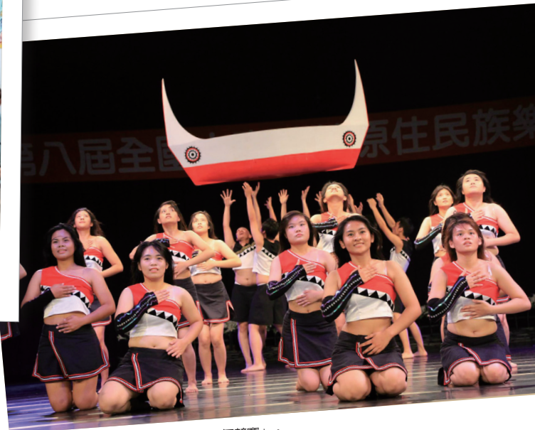
參與「第八屆全國大專院校原住民族樂舞競賽」。

二、「原住民創新舞蹈社」： 本社團將現代舞蹈的肢體延展動作融入原住民族傳統舞蹈，增添創作美感，歷年成果概述如上表。