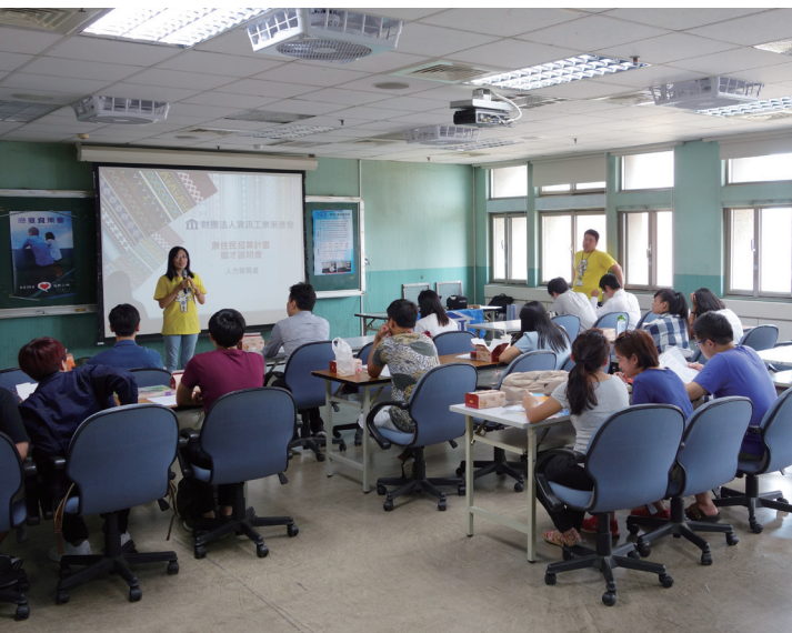
資策會於2015年6月3日舉辦原住民族暑期工讀暨職涯說明會。

除了訪談之外，原資中心亦嘗試辦理午餐約會，與同學聊聊生活的大小事。例如，有學生分享單親家庭的經濟處境，由於母親一直希望孩子能多打工以貼補家用，恰巧當時有某公司徵求暑期工讀實習生，在原資中心的媒合與推薦下，學生不僅獲得工讀機會，更可在頂尖企業實習。