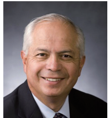
Larry Echohawk (波尼族) 於1991年當選愛達荷州檢察長。

1991年當選愛達荷州檢察長，為美國原住民第一人。1982-1984年間任愛達荷州眾議員。