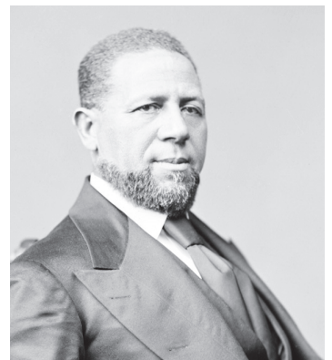
Hiram M. Revels（倫比族）於1870年當選密西西比州參議員。

1870年當選密西西比州參議員，為具備美國原住民血緣第一人。父親為倫比族，母親為美國黑人。