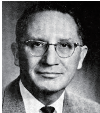
Benjamin Reifel（蘇族拉柯塔群）於1961年選上美國國會議員。