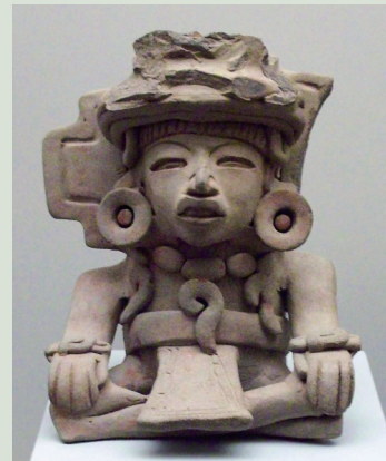
薩波特克族陪葬用陶偶。