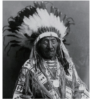
Red Cloud (紅雲)，蘇族拉柯塔群原住民領袖，於1868年迫使美國自原住民領域撤退。

1868年迫使美國自原住民領域撤退的原住民領袖，也是史上唯一。1970年代與1980年代反抗美軍之保留區制度。青年時期即因驍勇善戰享譽盛名，後成為該族領袖，以優異政治與軍事才能及慈悲心腸，而備受尊崇。