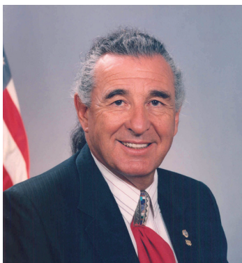
Benjamin Nighthorse Campbell（北部夏安族）於1982年當選科羅拉多州眾議員。

1982年當選科羅拉多州眾議員，為該州第一位原住民議員。1987年當選美國國會眾議員，為該州原住民第一人。1992年當選國會參議員，為美國原住民第二人，繼Charles D. Curtis（1907年）之後。除了參政，尚精於體