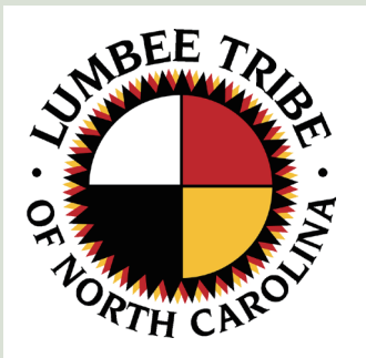
倫比族的官方標誌。

教育：早期曾設有民族學校，發展成今日的The University of North Carolina at Pembroke（北卡羅萊納大學Pembroke校區）。