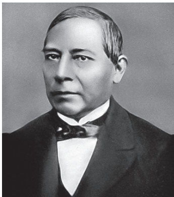
Pablo Bnito Juárez（薩波特克族）於1861年當選墨西哥總統。

1861年當選墨西哥總統，成為美洲史上首位原住民族籍國家領袖，也是墨西哥首位民選總統。1864年連任，直至1871年卸任。被譽為「墨西哥的華盛頓」，堅定提倡普羅大眾權利，尤其是原住民族權利。