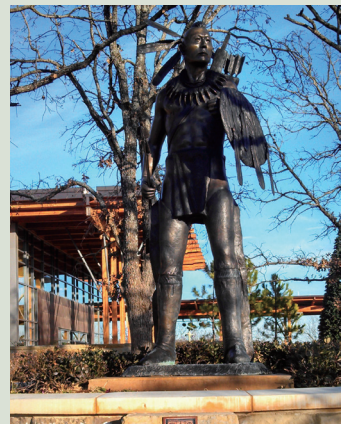
18世紀奇克索族戰士塑像。

教育：正在建置網站，讓本族兒童瞭解本族語言與歷史；提供民族教育課程協助教師教學。