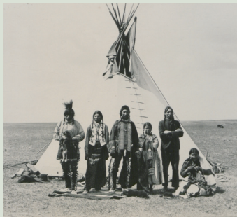
克里族人的傳統住屋。

教育：The Cree School Board提供學前、小學、中學教育，並鼓勵成年人繼續受教育和與職業訓練。