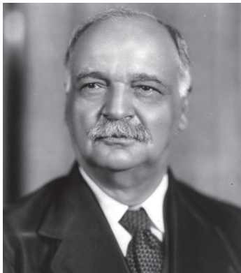
Charles D. Curtis (肯薩族 / 奧賽奇族) 曾任美國副總統 (1929-1933)。

1892年當選美國國會眾議員，為美國原住民第一人，任期至1906年。1907-1913年及1915-1929年間任職於國會參議院，為美國第一位原住民籍國會參議員。1929年辭去參議員一職，與胡佛（Herbert Hoover）搭配競選美國正副總統，1929-1933年出任美國副總統。前後任公職40年，無人出其右。