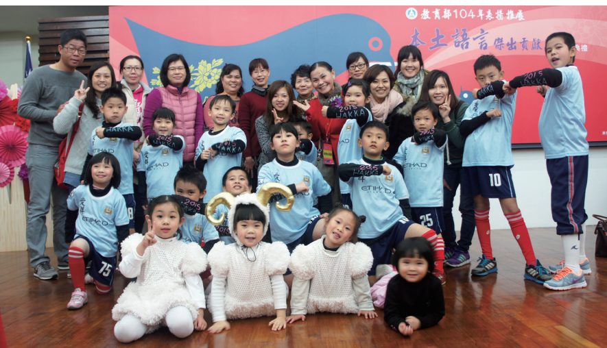
於2015年「教育部表揚本土語言推廣傑出貢獻獎」頒獎典禮演唱客家新世代。

幼兒階段所學習的語言，將影響其音調的準確性。而語言是文化的根，若客家孩子不會說客家話，文化何以傳承？族群認同從何建立？台灣的孩子若是失去自己的文化特色，又何以在世界立足？