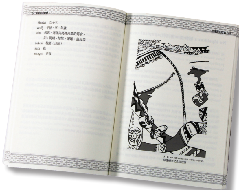
本書的第一部曲為「部落婦女故事」，其中的內頁插圖別具特色，包含許多排灣族的文化元素（繪者蔡愛桂，為排灣族著名畫家）。

本書主要內容為作者從前在日常生活與會友的交談與個人牧會感受。在台灣族群母語推行委員會的協助下，將讀本設計成排灣語／華語對照有聲書，光碟錄製採MP3格式，方便各種數位設備播放，可說是學習排灣語的良好入門教材。