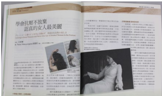
《原教界》第38期「浪子回頭」討論原住民學生在求學過程中的適應問題。「原教前線」專欄更邀請不同領域的原住民傑出人士，分享過去的求學挫折與生命轉折，圖為演歌雙棲的藝人高慧君。