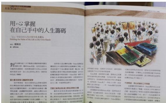
《原教界》第38期，Falas以過來人身分，勉勵原住民學子及早找到自己的方向。

傳播，乃至於反思工作。而關照的視野，則涵蓋過去與現在，台灣與國外，兒童與成人，時間性與空間性，知識性與實用性，語言學習與政策實踐，日常生活與學術研究，觸角從全台部落到海外他國，從地方建築、文物館、學校到各類原住民族人事物，全刊具有綿密而開闊的知識網絡，鉅細靡遺掌握、提供了各類教育訊息，尤其藉由每一期專題的引領，以深入淺出方式，精要呈現原住民族教育界的重要議題，期期精彩，且在訊息傳達背後，更流露出關愛與溫暖，〈浪子回頭〉便是佳例，這是刊物令人愛不釋手的溫度。