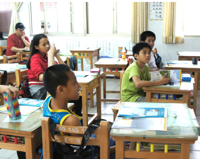
引導教學的教師必須觀察學童的特質，再營造良好的教學環境，是教學現場的關鍵人物。