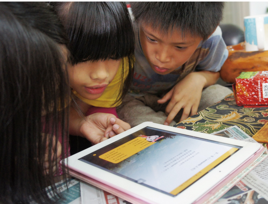
賽夏族的學童看著教材，興趣盎然地念出文中的生詞。

的意見，須適時引導。具體的作法是：（1）喜歡群體學習大過於自己學習，因此分組學習課程，其效果較佳。（2）喜愛傳說性質的故事帶入課程當中，學習上更傾向於動手操作，如直接穿戴傳統服飾來講解課程，勝過於使用圖片教學。