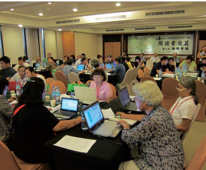
退休或現職校長、老師積極投入民族發展工作，族語教材編輯團隊中不乏其身影。