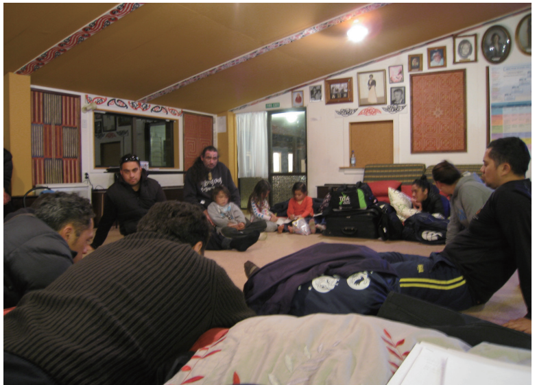
為了土地歸還而在集會所內開會討論。

進行田野調查時，恰好碰到部落中的大事：Ruapehu山南面的土地，包含與此鎮距離最近的滑雪場土地，都即將歸還部落。自1975年起，毛利人針對1840年代簽署的《懷堂依條約（Treaty of Waitangi）》中不平等的部分提出重新討論的要求，紐西蘭政府亦成立「懷堂依法庭」，將過去條約中不平等地剝奪毛利人權益的部分交由法律判決；於1985年開始，更將此追訴期延長至1840年該條約簽署的時間，亦即紐西蘭進入英國殖民的開始。