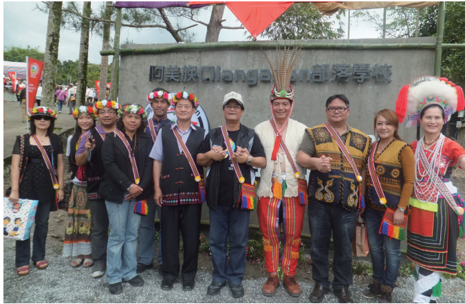
行政院原民會為保障原住民族教育權和文化發展，推動「部落學校設立十年計畫」。圖為阿美族Cilangasan部落學校掛牌開學。