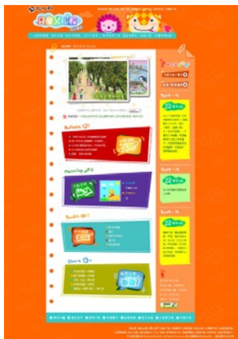
「兒童文化館」網站由文化部建置，是孩童專屬的線上閱讀園地，設有「主題閱讀區」與「繪本花園」兩大動畫單元。

作自許多國內自創與外語譯作的優良圖畫書，除能引領孩童欣賞圖像之美，培養美感經驗之外，更經由進入動畫故事的情節發展，享受閱讀的樂趣，並補充語彙資料庫與精進文學鑑賞能力。