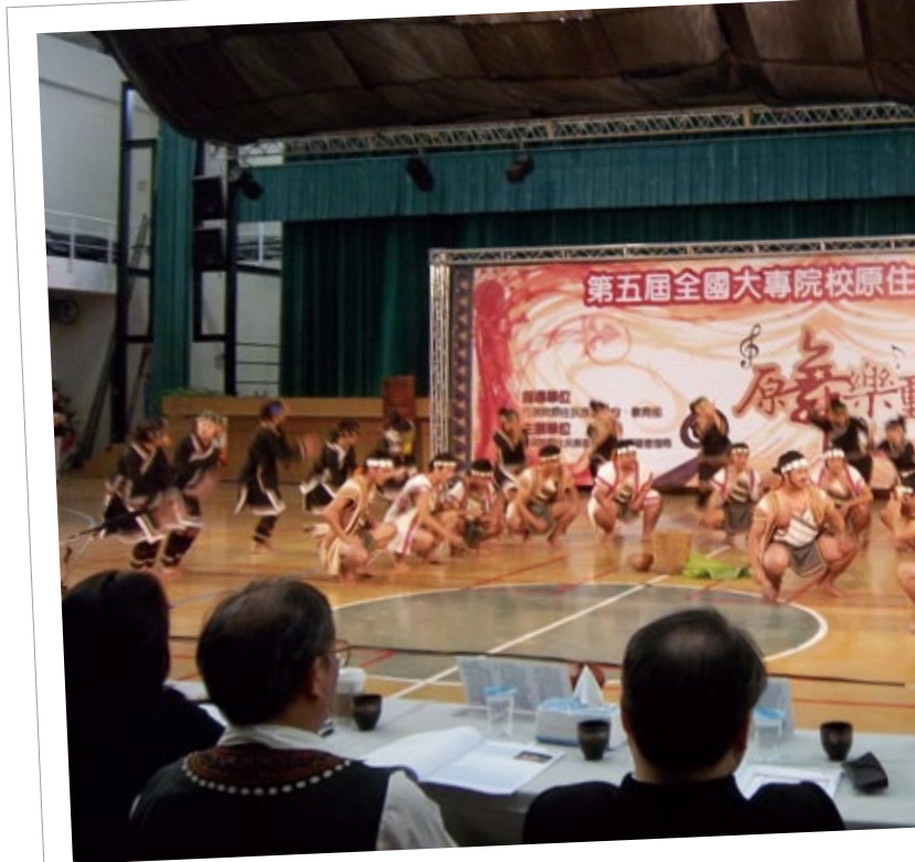
原住民專班學生對於原住民族樂舞相當投入。