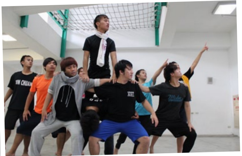
新傳社是絕大多數原住民同學的「家」，圖為社團活動練習比賽舞碼。

計、應用英語、應用中文、應用日文等模組課程。101學年度原住民專班則將回歸於休產系設置。目前專班各分別在觀光管理學系四丁班、休產系三乙班、文創院專二班及專一班，合計4個班級，學生數約130