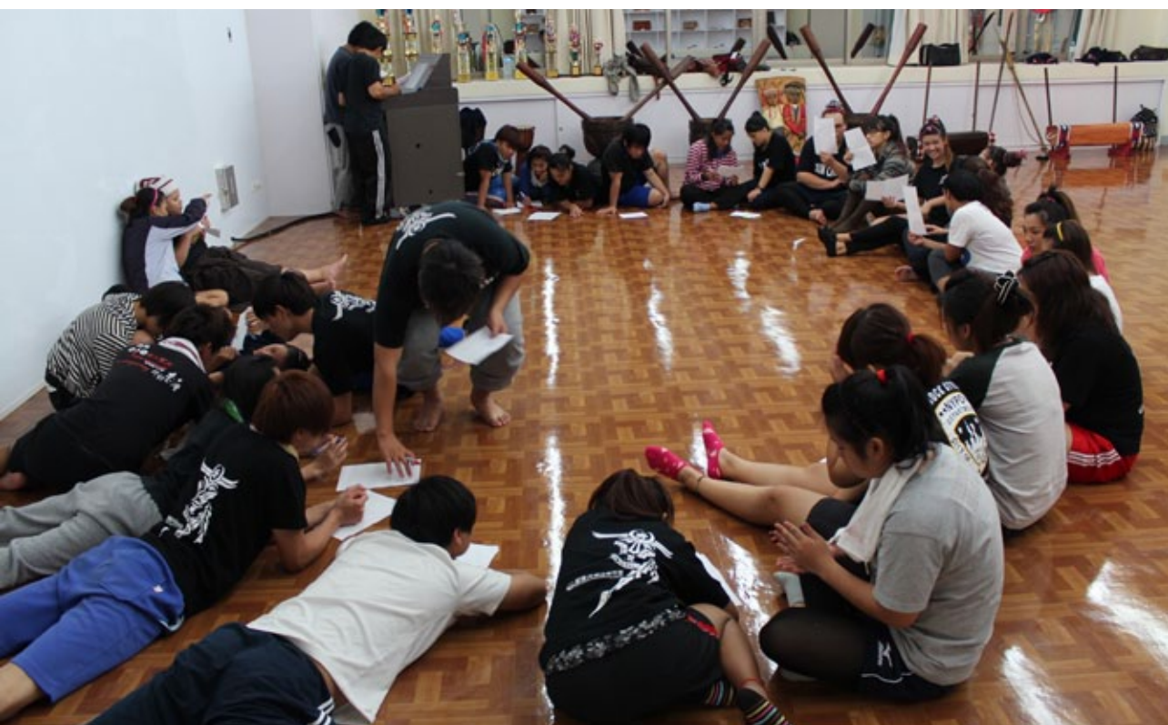
由於專班都是原住民學生，同儕互動有助於體認民族語言文化的價值。