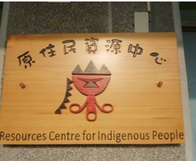
實踐大學高雄校區設有原住民資源中心。