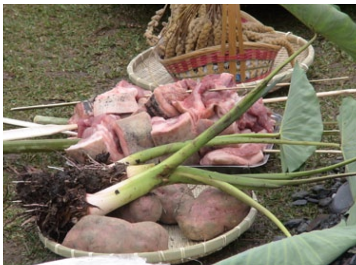
賽德克族的祭典中，小米與豬肉是不可或缺的祭品。