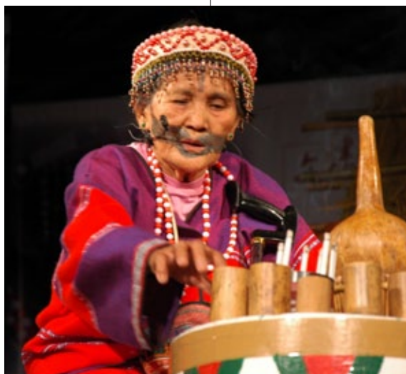
賽德克族祭拜祖靈的儀式。