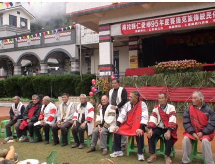
2006年賽德克族在仁愛鄉平靜國小舉辦傳統民俗文化活動，Tgdaya、Toda、Truku的耆老都與會參加。

賽德克族的收穫節，過得就像平地人的過年，雖然少了一點傳統祭典的莊嚴，但是熱鬧繽紛的色彩，可以提升年輕人的參與感。但是更要注意的是，不能讓收穫節變得觀光化，這樣就喪失政府給予原住民族國定假日的意義，因為文化的傳承比經濟的效益更值得維護。