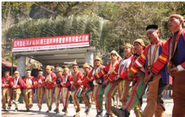
鄒族呈現4個不同期間與不同類型的歲時祭儀放假日，堪稱多元的代表。圖為沙阿魯阿鄒族貝神祭。

南鄒族的沙阿魯阿人有獨特的Miatungusu（貝神祭），每兩年舉行1次，失傳多年後，在1993年恢復。相傳沙阿魯阿祖先要與小矮人分居遷往他處時，小矮人贈送珍貴的12顆貝殼，據說這些貝殼可帶給族人豐收、健康、聰明、勇猛等。貝殼封存在一個甕中，多次顯靈，從此貝神就成為鄒族的主要神明，貝神祭也被視