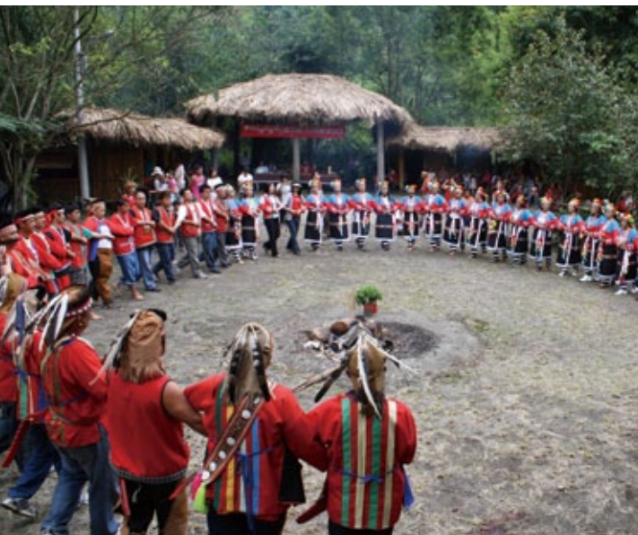
南鄒族卡那卡那富人的Mikong（米貢祭）。