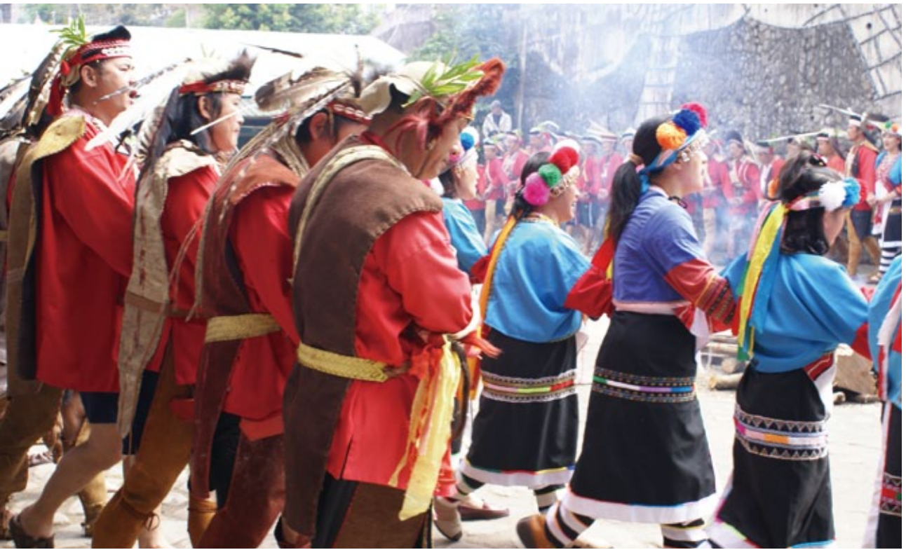
北鄒族在會所及其廣場前舉行Mayasvi (戰祭)，歌頌偉大的戰神及英勇的祖先。