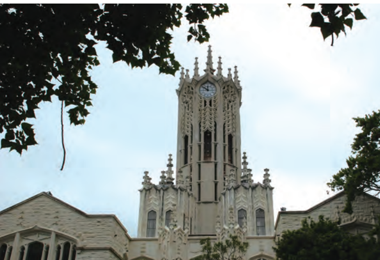
奧克蘭大學的行政大樓。