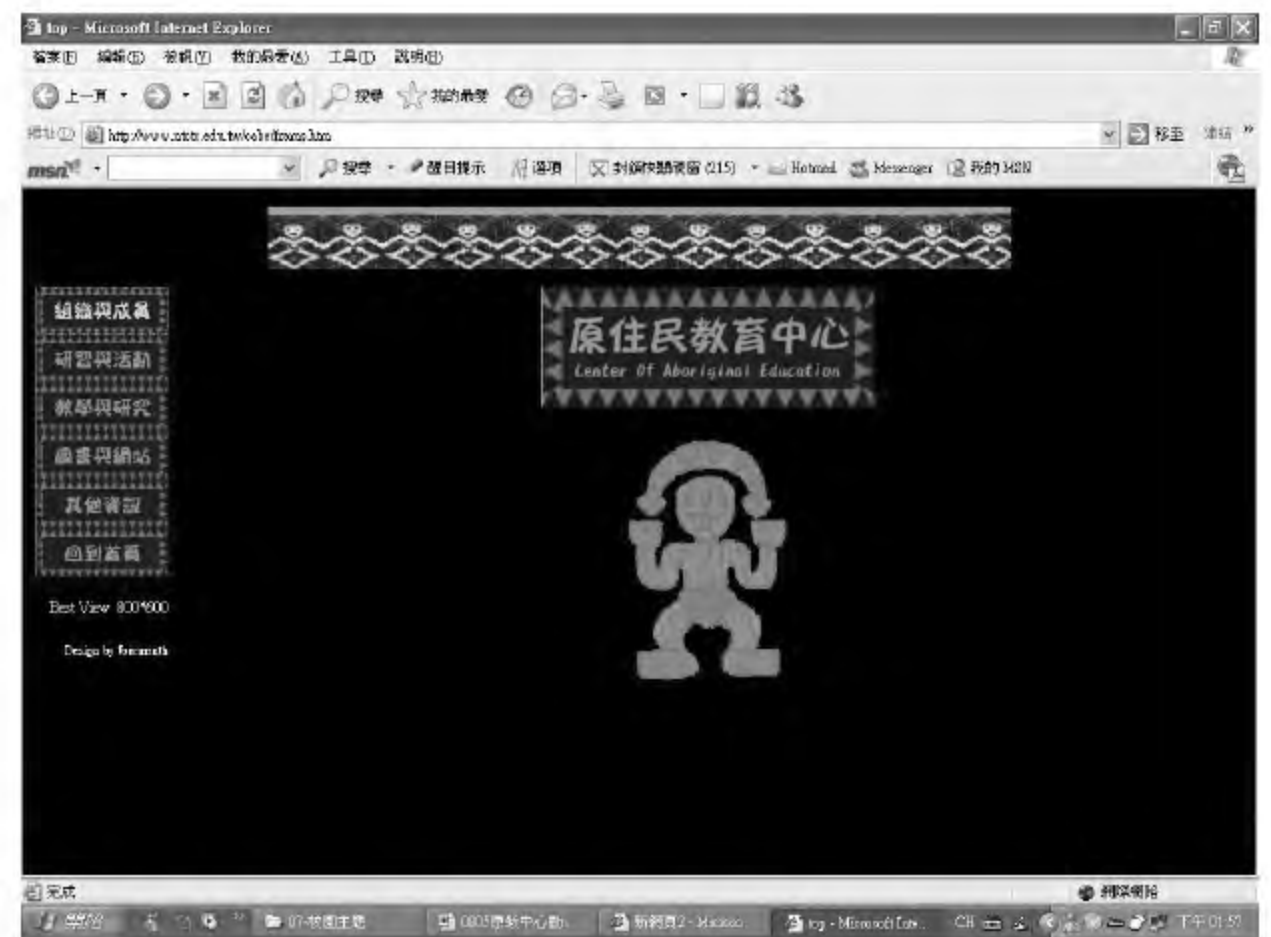
▲ 台中教育大學原教中心的網站首頁。

該中心因缺乏專任人員與經費來源，業務逐年萎縮，學校也計畫在今年8月改制為教育大學後，結束原住民教育研究中心。中部地區原教工作的推展，亟待開創出另一番新的面貌。 (資料提供：台中教育大學原住民教育研究中心。網址： http://www.ntctc.edu.tw/cabe/index.htm )