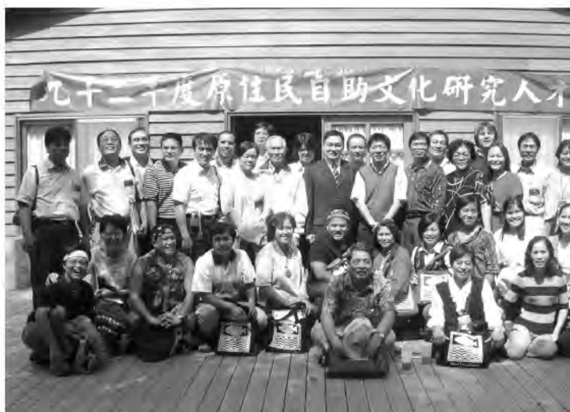
▲ 台東大學原教中心辦理自助文化研習營學員合影。