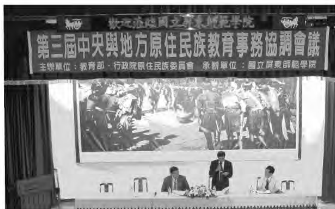
▲屏東教育大學原教中心辦理2004年第三屆中央與地方原住民族教育事務協調會議。

該中心在2004年辦理完成了「第三屆中央與地方原住民族教育事務協會」、「93年度原住民族教育資源中心暨資源教室實施計劃（南區）」、「93年度原住民族教育活動實施計劃（南區）」、「93年度原住民自助文化研究人員實作南區初級班」、「93年度原住民族籍學生就讀大專校院獎助學金核發工作計畫」、