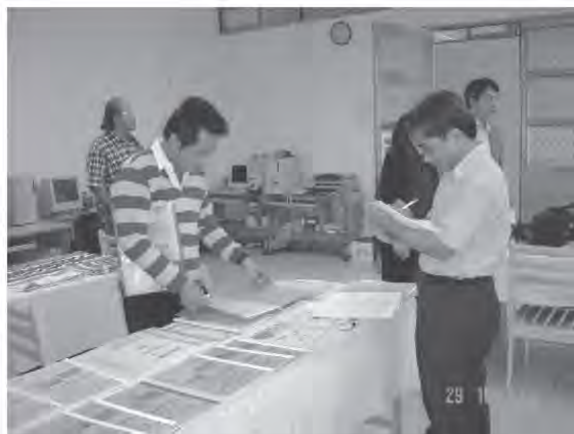
▲ 台東大學原教中心辦理民族教育活動評鑑訪視。