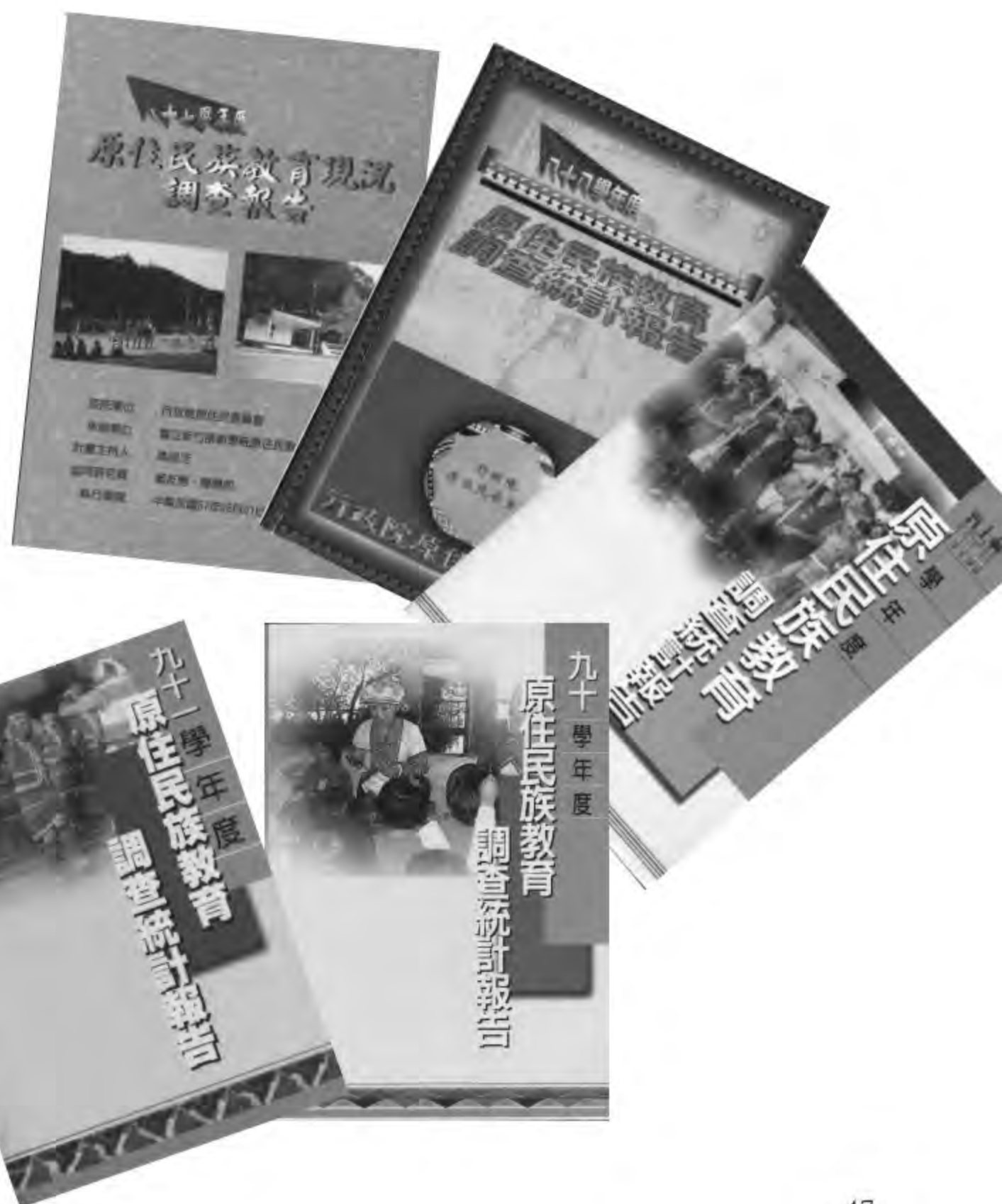
新竹教育大學原教中心歷年進行的 原住民教育調查統計報告