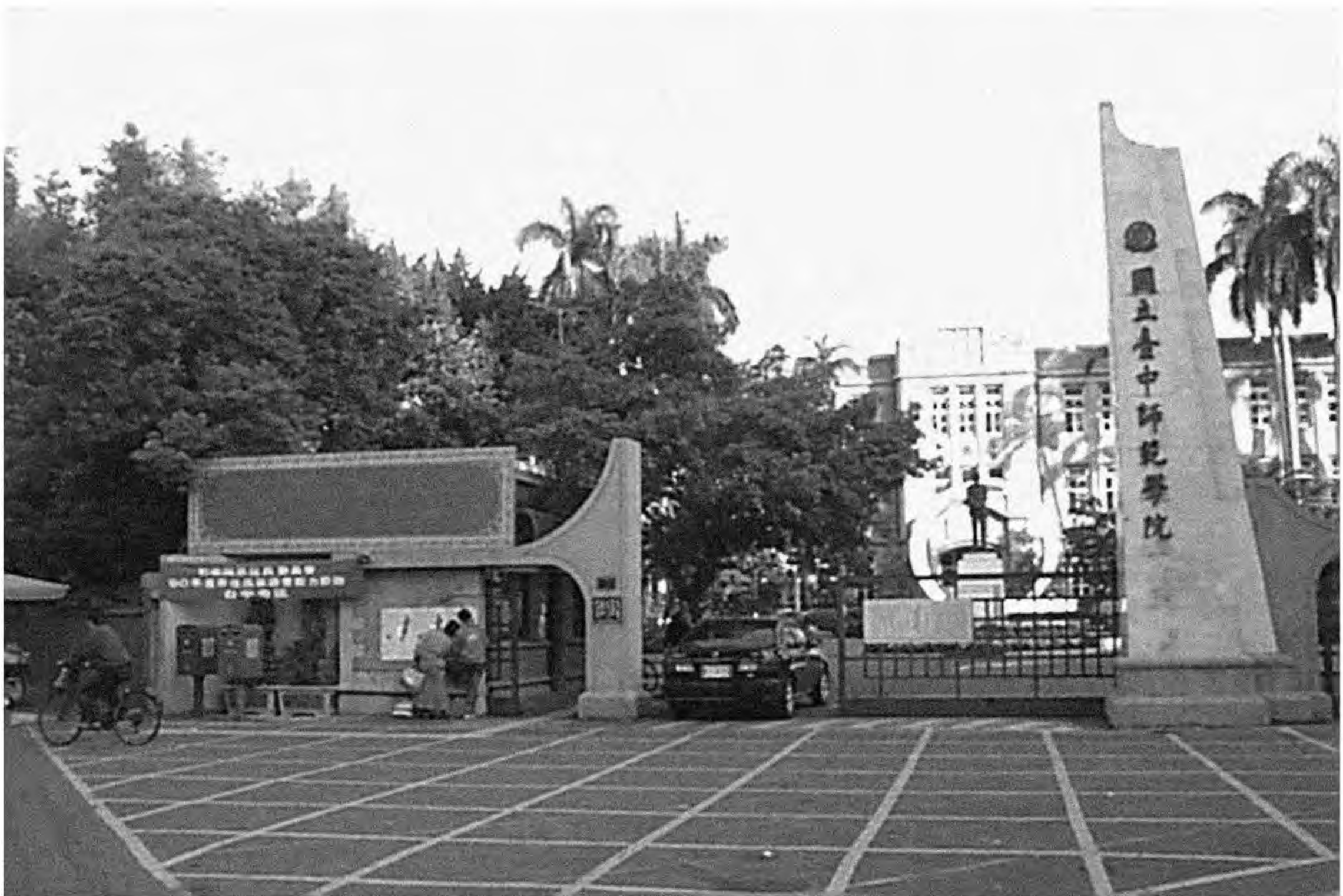
▲ 台中教育大學校門。