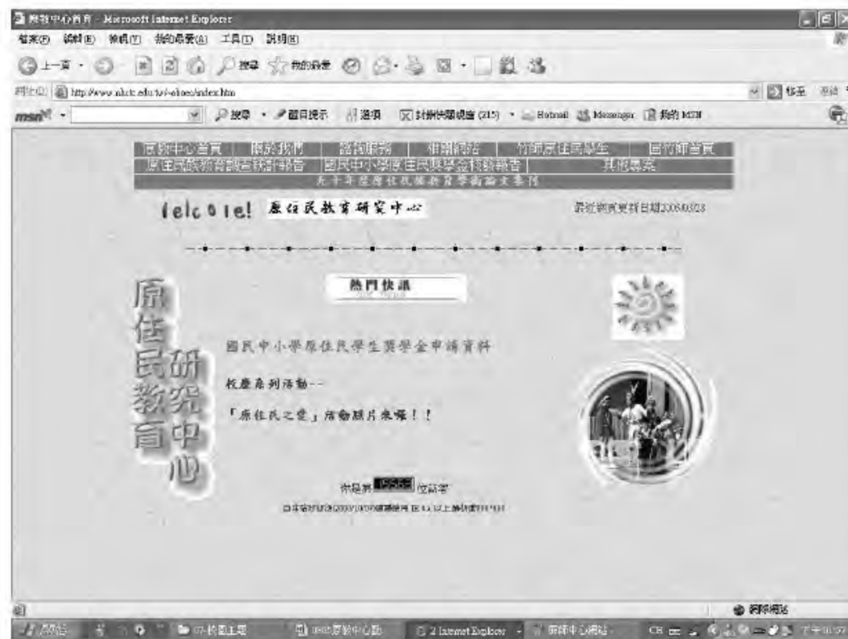
▲ 新竹教育大學原教中心的網站首頁。

(資料提供：新竹教育大學原住民教育研究中心。網址： http://www.nhctc.edu.tw/~aboec/ )