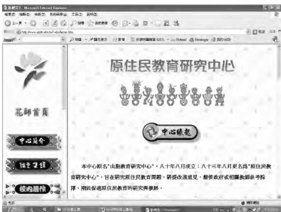
▲ 花蓮教育大學原教中心的網站首頁