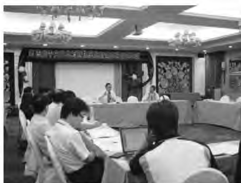
▲ 花蓮教育大學原教中心辦理2005年第四屆中央與地方原住民族教育事務協調會議。