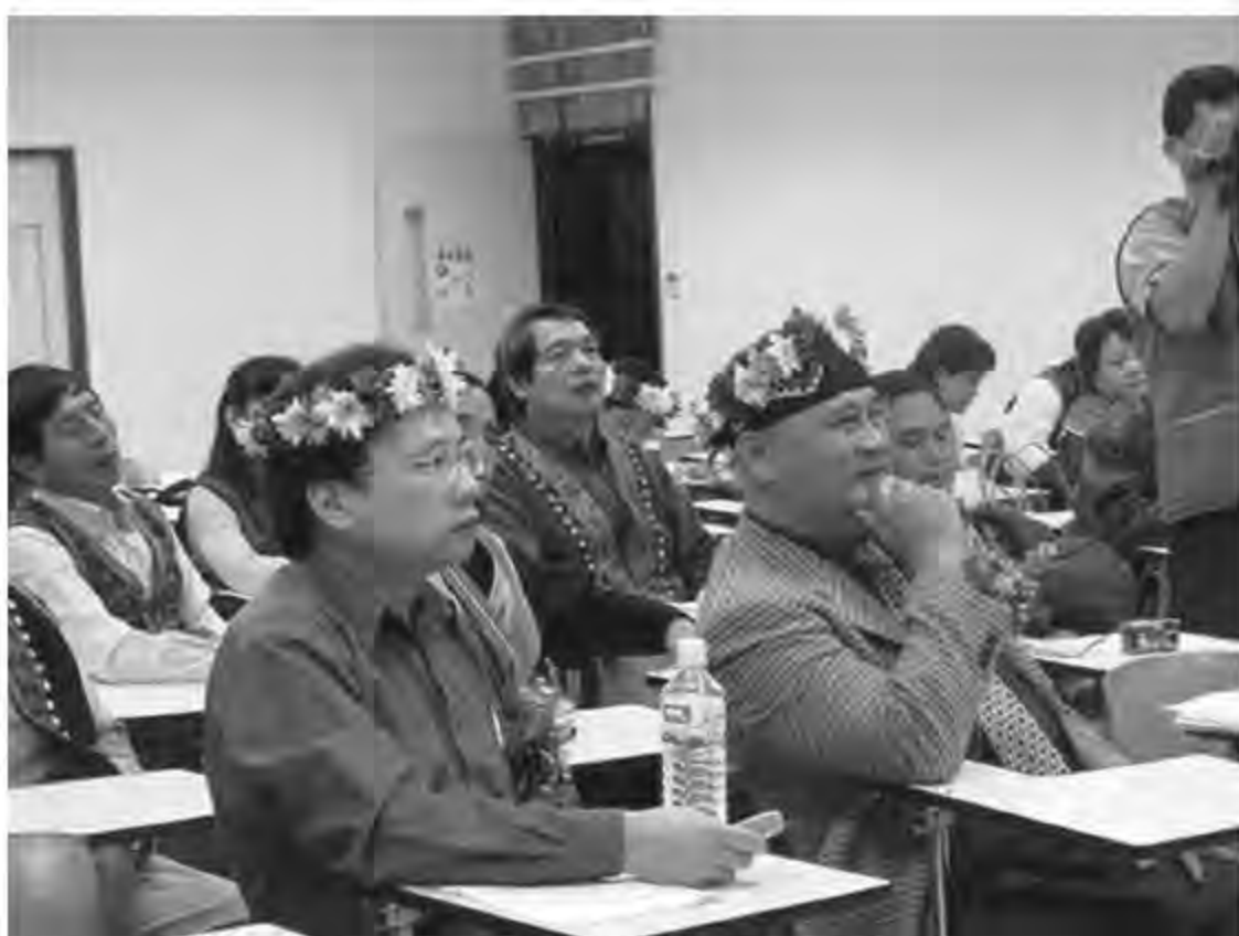
▲ 台東大學原教中心辦理族語教師專業學分班。