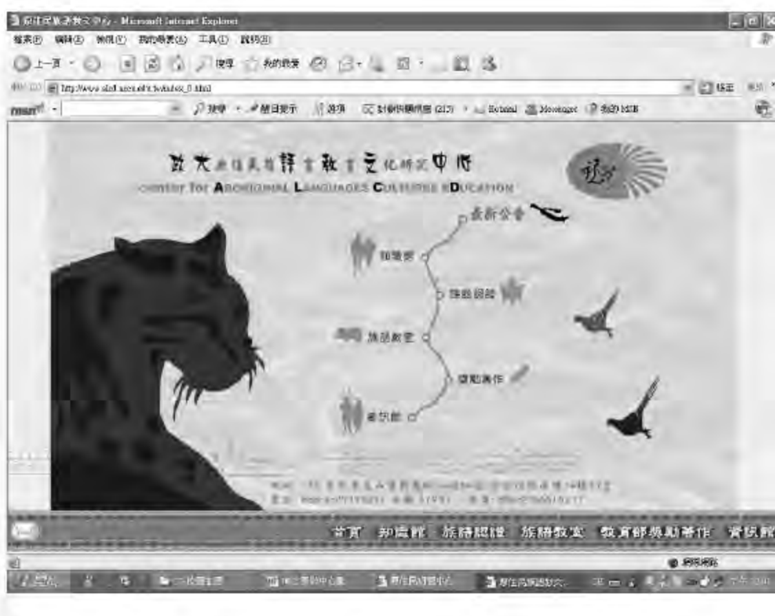
▲ 政大原住民族語教文中心的網站首