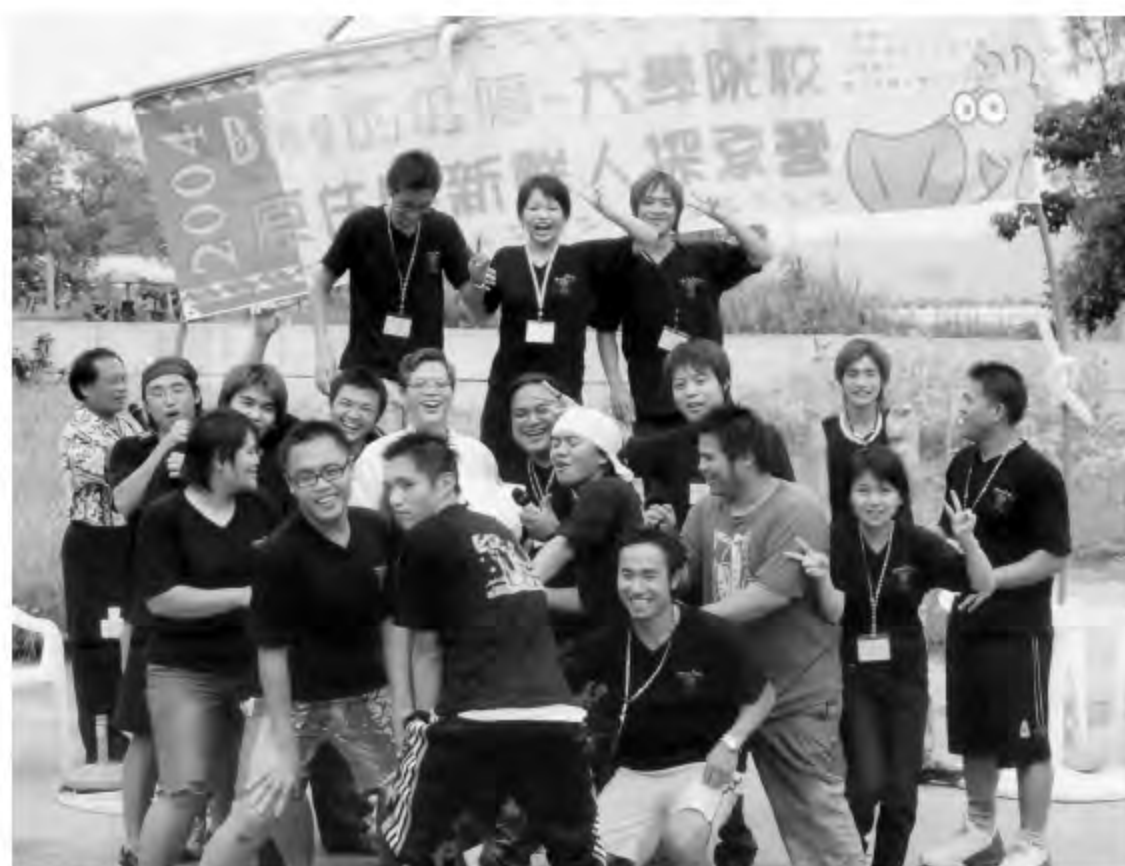
▲ 2004年東華大學原住民研習中心所辦理的原住民大學生新鮮人探索營活動。