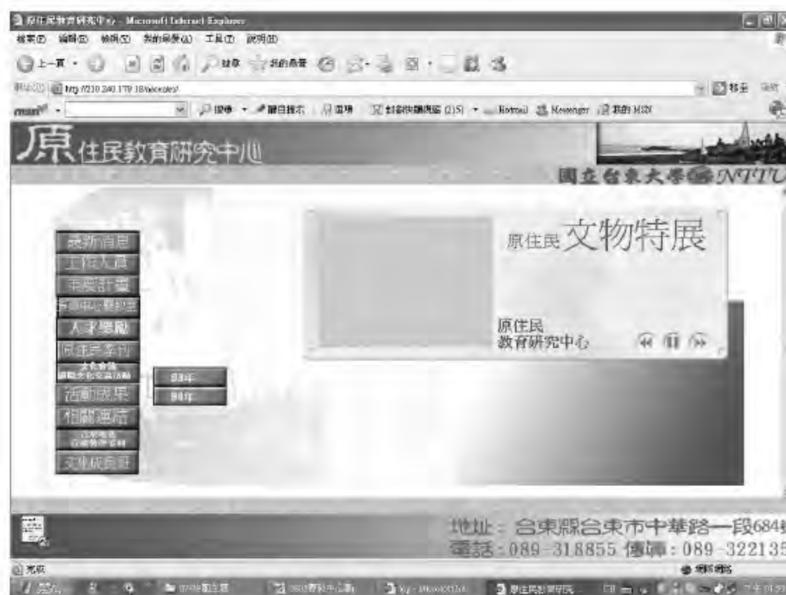
▲ 台東大學原教中心的網站首頁。

該中心長期受原民會委託推動的工作有「獎勵原住民專門人才獎金核發作業」（2003-2005）、「原住民族資源教育中心暨資源教室」（2003-2005）、「原住民族語教師專業學分班」（2002-2005）、「原住民族文化成長班」（2003-2005）等計畫及活動，這些工作都具有持續性。今年對於蘭嶼地區新進國中小教師的輔導工作也特別重視，將辦理教師研習活動。（資料提供：台東大學原住民教育研究中心。網址： http://210.240.178.18/nacenter/ ）