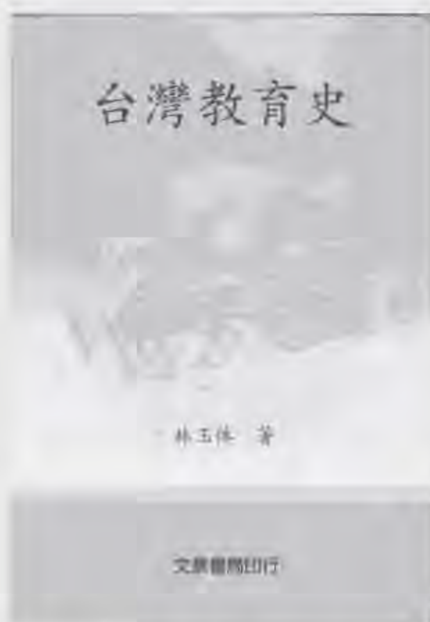
林玉体《台灣教育史》 (2003。台北：文景書局) 300頁

主性，但部落力量太弱，而終被外來的力量改變，令人同情，字裡行間展現台灣社會常見地對原住民遠距離的溫暖。