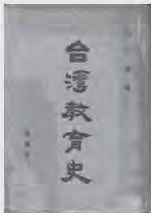
▲ 汪知亭《台灣教育史》 （1959。台北：台灣書店） 268頁

綜覽全書，在國民政府來到台灣初期，一位教育家對當時政府除（日本）舊佈新（國民政府）的殷切希望，還要關心教育要如何為「國文第一」、「師範第一」的反共復國偉業與儲備重建大陸人才效力，眼睛。全書對原住民教育著墨很少，只有一頁專節評論「高砂族教育所」和四行描述談原住民的社會教育措施。作者覺得「山地同胞教育在日據