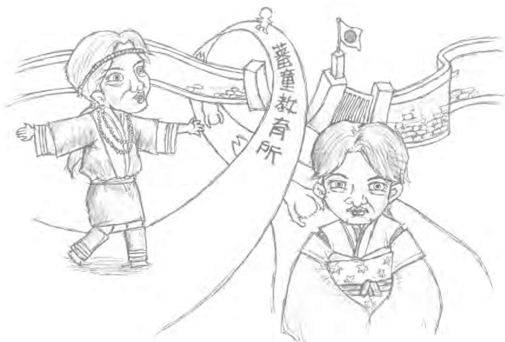
插圖 / 王嘉棻

自20世紀末到21世紀的今天，在世界各國的民族意識與人權意識與少數民族之權利回復運動等的聲浪正不斷地持續高漲。在這波歷史的潮流中，1980年後以來，隨著台灣民主化、自由化與世界先住民運動的趨勢，導致台灣原住民的社會文化也隨之激變，台灣原住民權利回復運動及民族意識的抬頭也日益增漸。在近年台灣『本土化』意識·原住民『回復運動』重視的情形下，台灣原住民研究也多方面地加以進行；日本民族學搖籃地-台灣，正是讓日本民族學發揚光大且創下許多先驅性研究的成果之地。