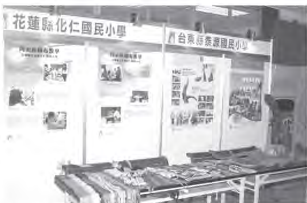
▲ 花蓮縣化仁國小的織布成品、台東縣泰源國小的漂流木。

(2)技藝與藝術教育活動成果：參展內容包括台北縣烏來國民中小學的「泰雅族藝術教育」、屏東縣泰武國民中學的「排灣族傳統木雕教學」、國立仁愛高級農業職業學校的「原住民舞蹈、歌謠研習」、台東縣泰源國民小學「阿美族木雕-漂流木裝置藝術」等。