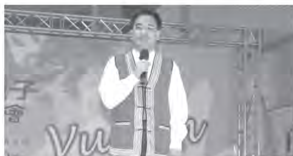
▲ 行政院原住民族委員會副主任委員夷將·拔路兒長官致詞。

博覽會開幕式在10月21日(五)上午舉行，由行政院原住民族委員會副主任委員夷將·拔路兒主持，民族教育活動動態成果展演包括：