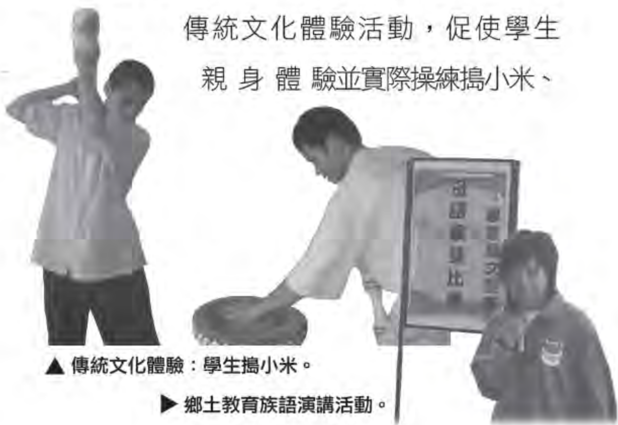
▲ 傳統文化體驗：學生搗小米。