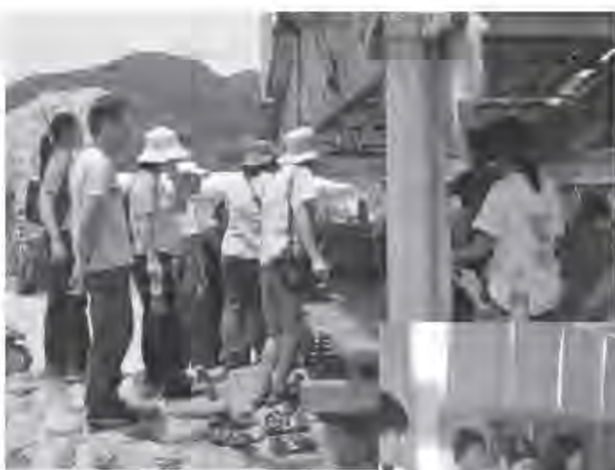
▲ 新進教職員研習：參觀蘭嶼傳統屋建築。