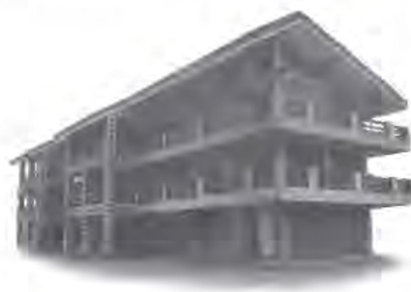
▲ 蘭嶼中學教學大樓。