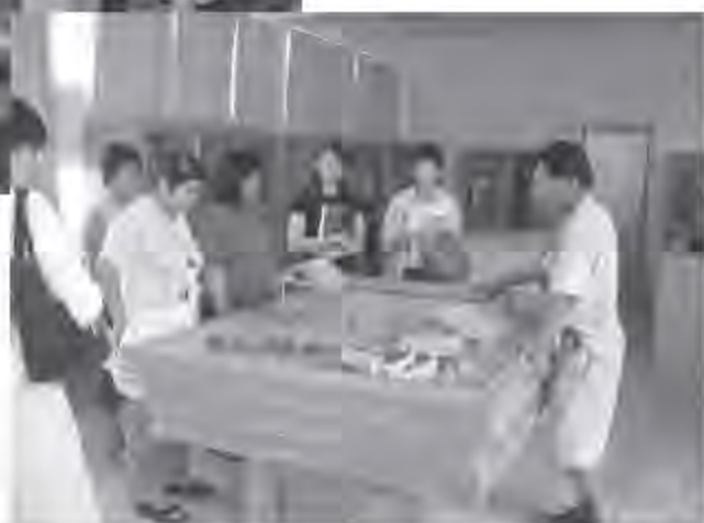
▲ 達悟文化之傳統建築研習：透過傳統屋模型了解當地文化特色。

嶼文化之旅，期透過相關研習更能了解當地文化特色，俾助教師於教學方面，加速了解當地學生特質，進而融入教學情境中。