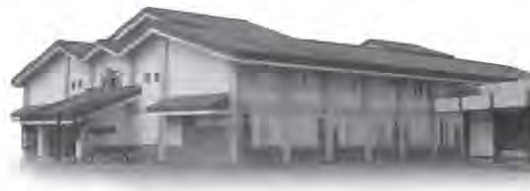
▲ 蘭嶼中學學生宿舍。

蘭嶼中學教師大多來自外地，為使教師加速融入學校教學情境，透過教師研習來了解當地文化特色，相關研習除提升教師專業知能，並邀請當地文化工作者臨校講演，除此之外，每學期初學校為新進教職員辦理蘭