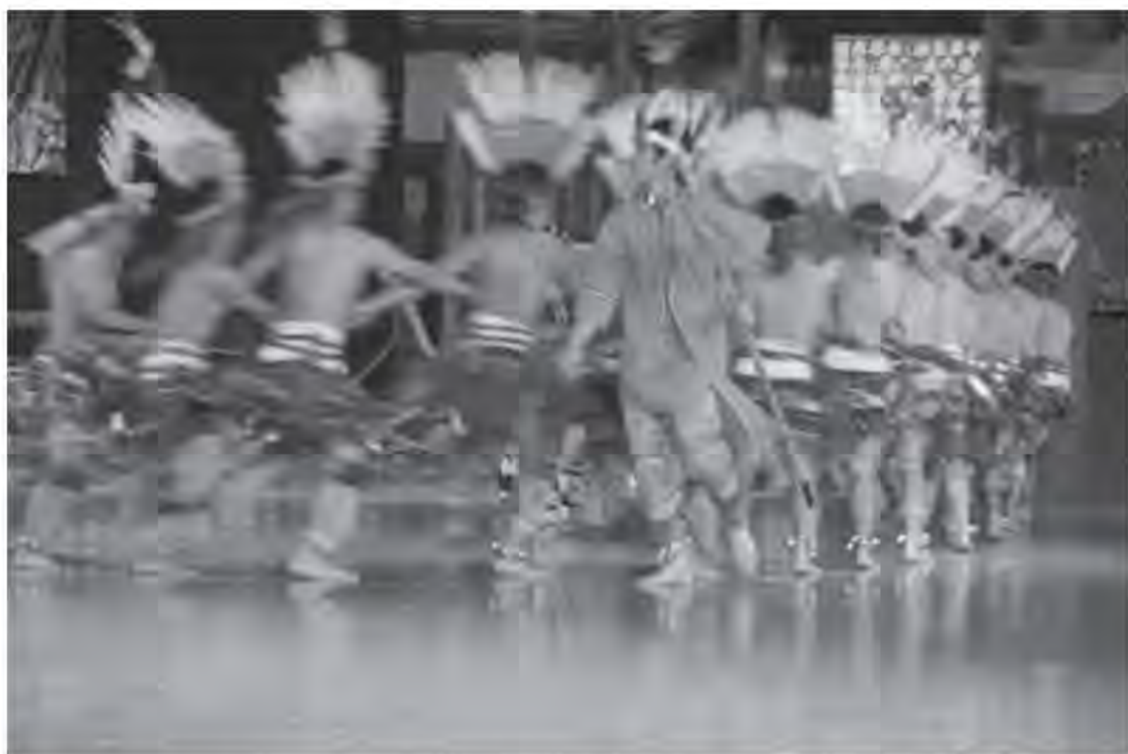
▲ 由五所學校的原住民藝能班學生及園區專業舞者共同演出原住民樂舞。

● 第三項特色活動 文化體驗活動預計於6月2日上午09:00~14:00進行，邀請當地工作坊於園區『林蔭大道』進行工藝diy的活