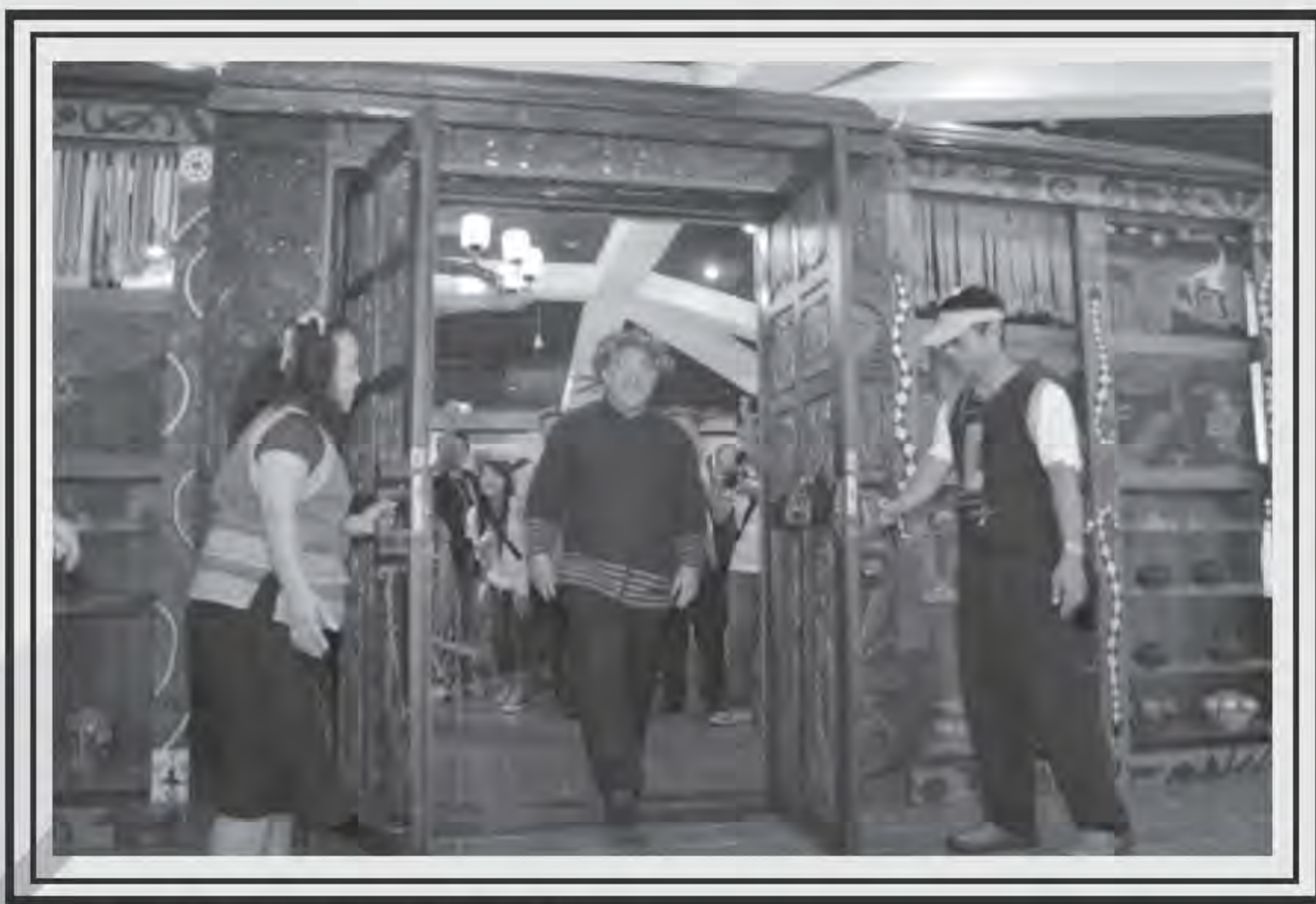
▲ 開幕儀式由瓦歷斯·貝林主委親自主持。

台灣原住民族在藝術領域方面一直有傲人的成就，建立多元文化教育型態，傳承原住民藝術與文化，發揚本土化藝術特色，也是原住民教育政策的主軸。教育部自八十八學年度起在高中職設置原住民藝能班，甄選在音樂、美術、舞蹈及其他藝術領域上有天分的原住民國中畢業生入學，計畫性培育具有藝術才能的原住民學生能更上一層樓，以造就更多原住民的藝術人才。