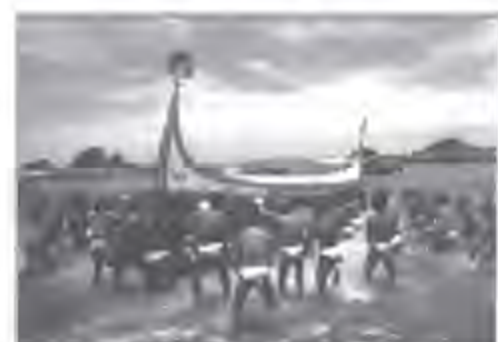
◎ 2-1-12 達悟族的飛魚祭。在達悟族的習俗中，每年在捕捉飛魚之前，必須要舉行「飛魚祈禱祭」，由族中的長老擇定良辰吉日，召集壯丁穿著全副武裝，念咒作法，儀式莊嚴隆重，場面浩大熱鬧。

在62頁中，也提供一張原住民分佈圖，讓學生得以知道原住民的祖居地各在台灣的位置與範圍。但以下有三處問題點，提出參考：