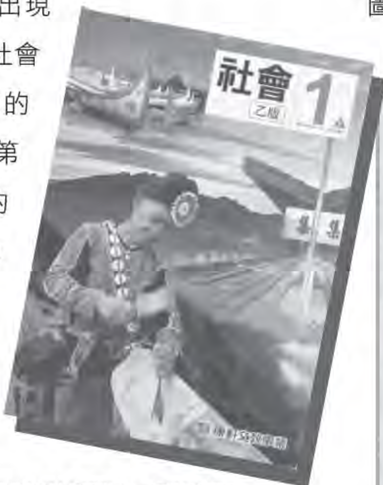
康軒版社會科第一冊的封面。▲