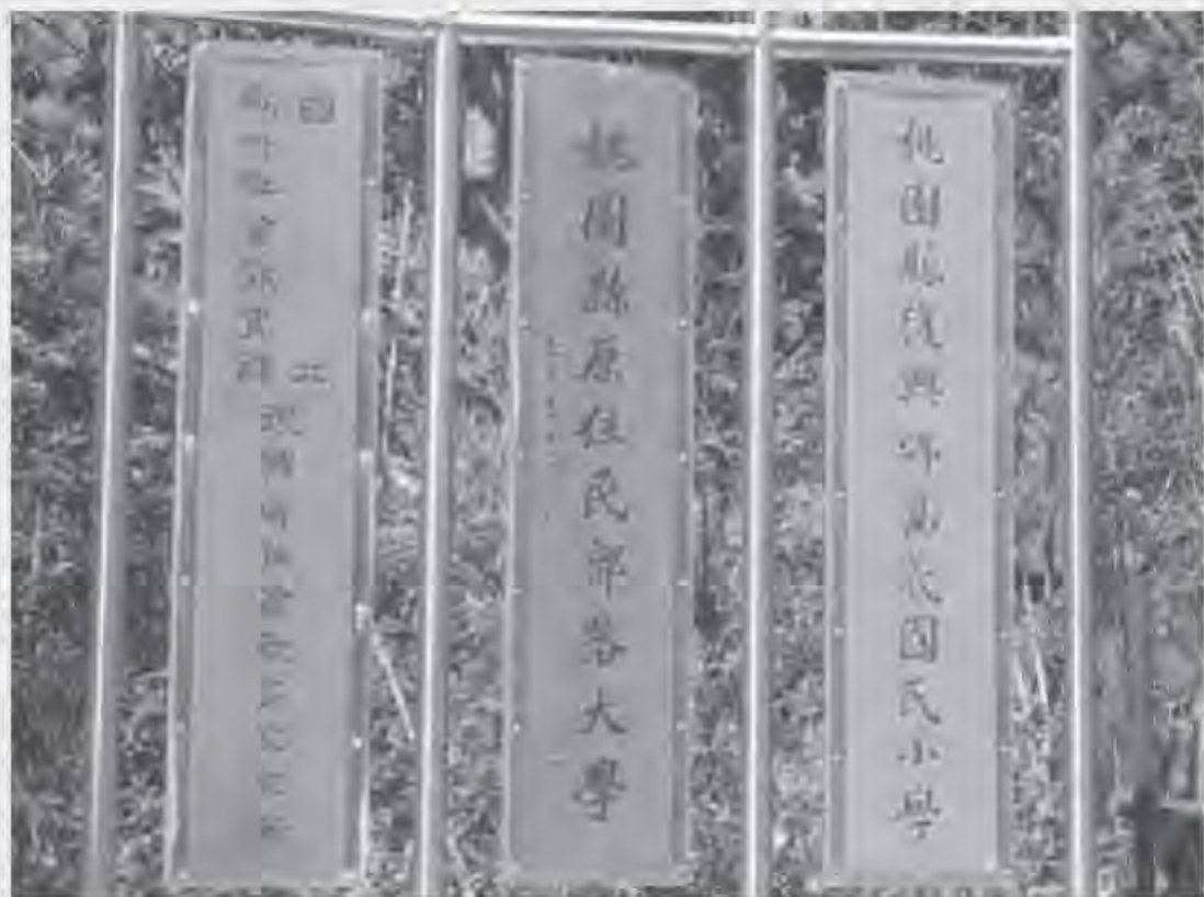
▲ 桃園縣原住民部落社區大學以「部落大學」為名掛牌。