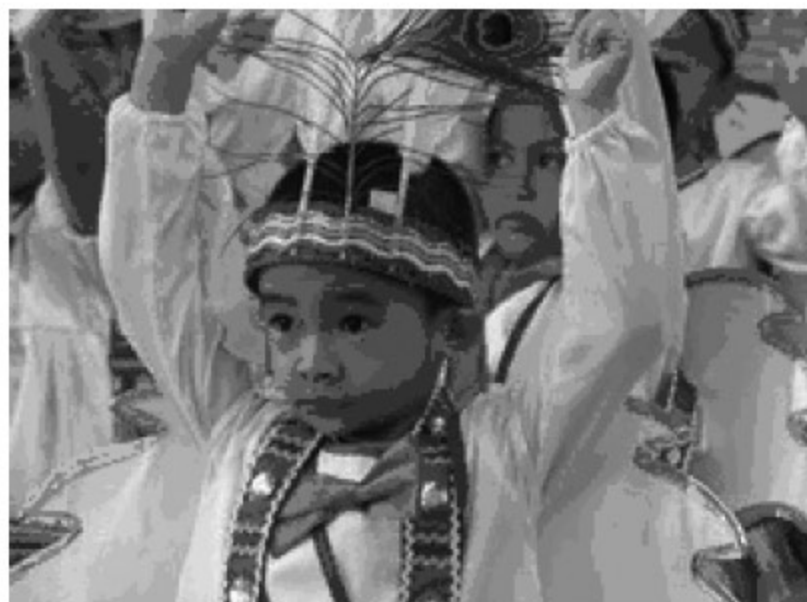
▲ 原住民幼兒在國幼班開學典禮時手足舞蹈的表演。