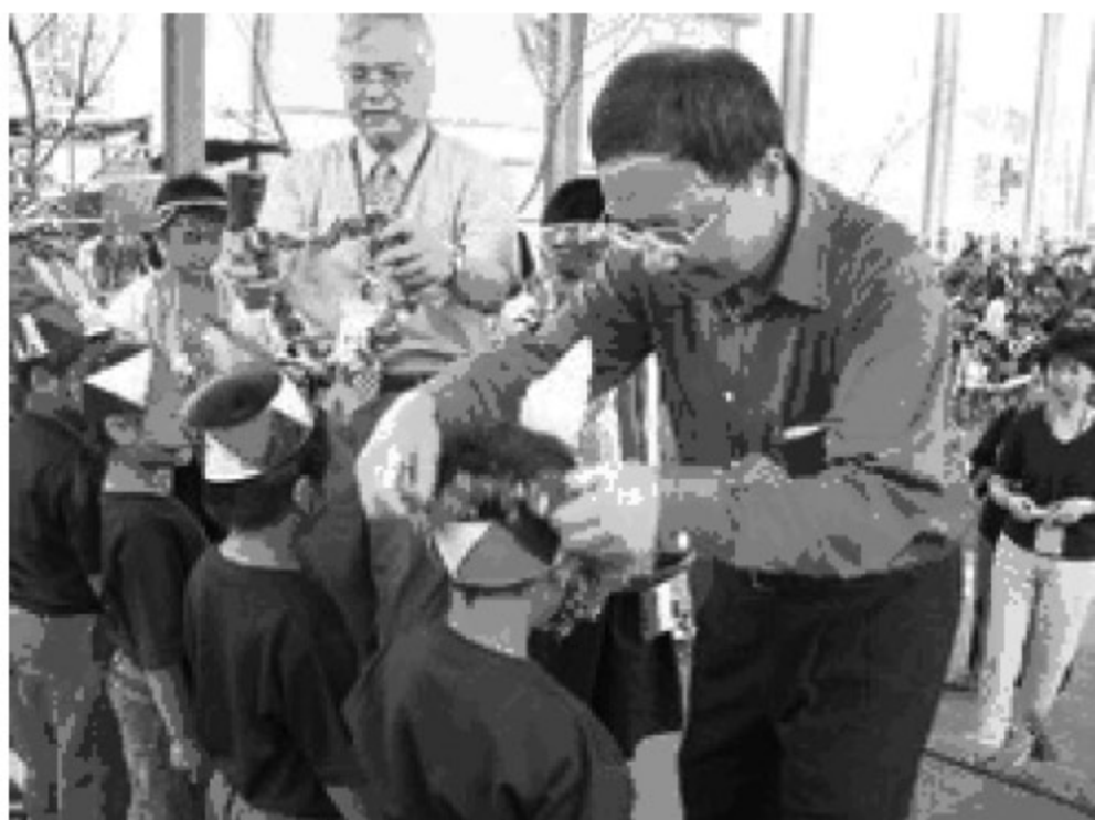
▲ 2006年6月23日，原住民族地區國民教育幼兒班第一屆畢業典禮，杜部長與家長分享孩子成長的喜悅。

相同的觀點還有教師認為族語學習其實並不是那麼重要，他們的意見是，「不需過於強調族語的學習，因現今說族語的機會較不頻繁，且沒有文字系統的輔助，還是要加強國語教學」、「雖然認同推動鄉土教學，但還是以國語為主，閩南語、客家話、原住民語次之」、「英語及道德文化的學習才是不可或缺的」。尚有些意見是：「在推動族語前，更重要的應該是先重視原住民的社會照顧及家庭改善」，意指社會照顧及家庭改善等求生階段的問題，對有些教師來說，比起族語及鄉土文化教材來得更重要。