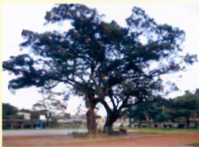
圖1：花蓮縣明禮國小百年老樹

明禮國小的校名更迭（台東國語傳習所奇萊分教場—花蓮港公學校—花蓮港市明治公學校—明治國民學校—明禮國民學校—明禮國民小學）見證了花蓮的發展。創校校名為「台東國語傳習所奇萊分教場」，意味著日本人對東台灣的設治管理，是由南而北的，1905年改名「花蓮港公學校」。花蓮港是人工港口，興建過程動員很多花蓮原住民參與，是日治時代在東台灣最大的國家建設。之後日本積極經營東台灣，花蓮市人口超過半數是日本人，號稱要將花蓮建設成「距離母國一千里外，最美麗