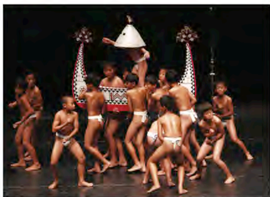
2007年比賽，國小組蘭嶼椰油國小雅美族傳統舞蹈表演