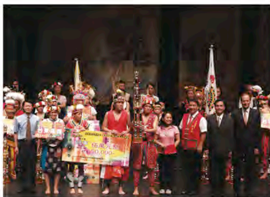
國小組第二名：宜蘭縣四季國小