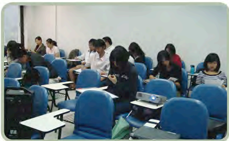
阿美語課程的學生修課情形。

因考量到語言課程採小班教學模式，故每類族語課程一般約有6到8名同學。各族語課程的修習方式，是以學生大一期間的班級成績排名，再輔以其所選填之語言志願順序