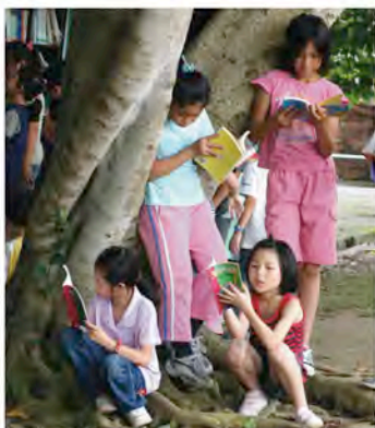
小朋友的陶醉與認真。