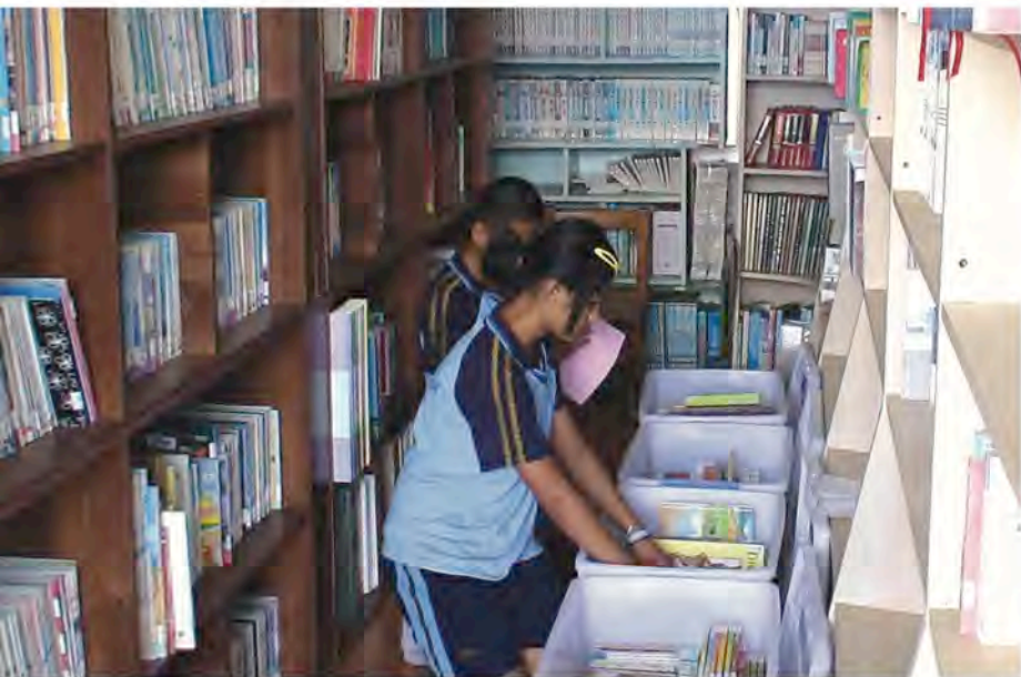
圖書輪動。

「培養孩子的閱讀能力，如同給他一對可以飛出低谷的翅膀」是「行動圖書館」堅守的信念。無論是富邦文教基金會或屏東教育大學的「行動圖書館」，執行方式雖不盡相同，但皆能夠善用有限的資源，使書籍發揮最大效益。行動閱讀是長久且漸進式的計畫，從富邦到屏教大，如同從播種到深耕。相信這樣的深耕計畫，能夠慢慢讓偏遠地區的孩子主動汲取知識，降低城鄉學習資源的落差。◆