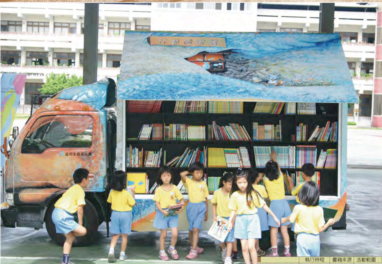
撲撲與大里國小的孩子們。