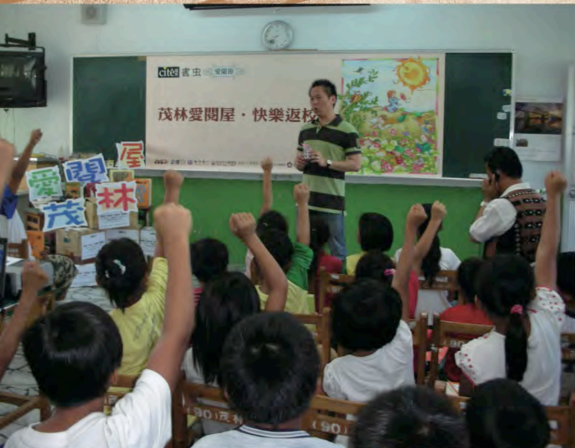
大家都踴躍要 翻翻新書。