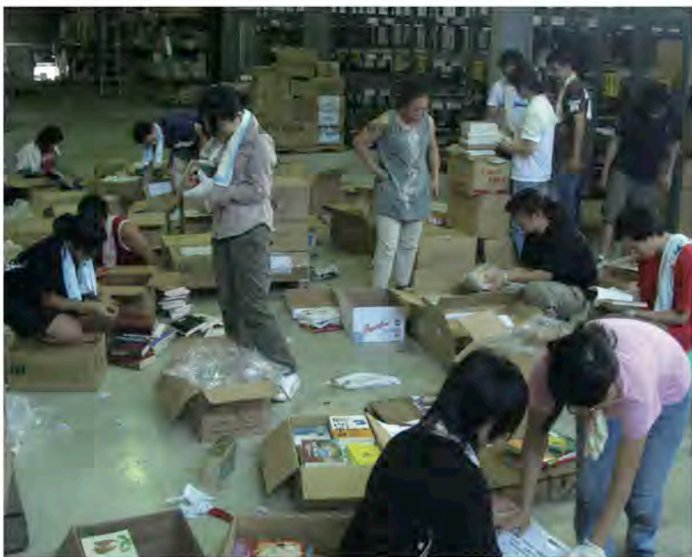
在書海中奮鬥，整理堆積如山的贈書。