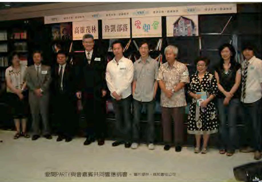
愛閱PARTY與會嘉賓共同響應捐書。

柔甫主任表示，雖然沒有明確的數字能夠呈現圖書增加後的變化，但是他相信，這數千本的圖書，的確為孩子們的進步帶來很大的助益。