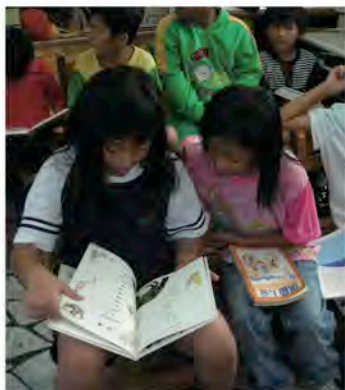
小朋友們翻閱書籍的狀況。