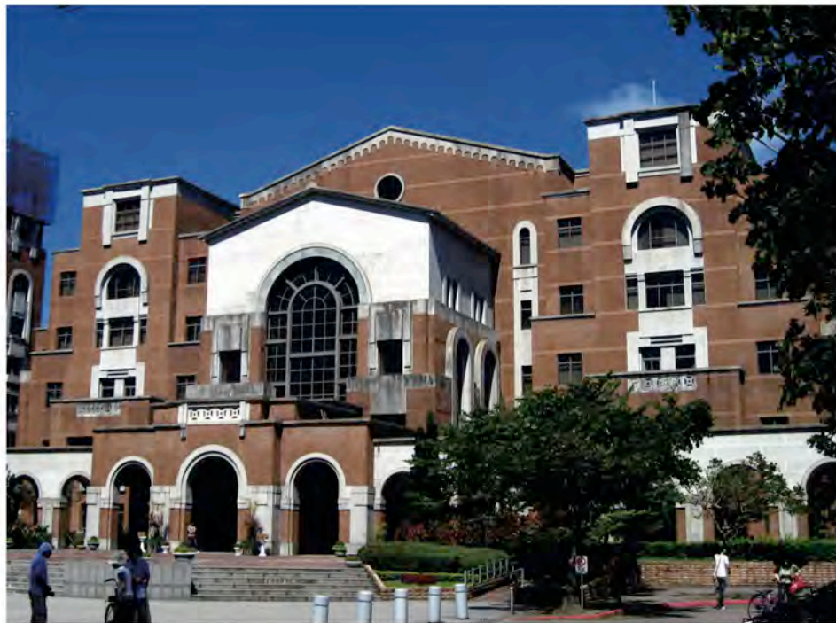
台大圖書館總館 大門入口處。

這裡要特別說明的是，2006年才由行政院原住民委員會委託台大圖資所成立的「台灣原住民族圖書資訊中心」，因為其設立目的就是以原住民為主題的搜集館藏，所以在短短兩年多的時間，彙集近2000件館藏，所以我們看到台大的藏書數量最多，這使得台大的原住民文化圖書的館藏量，較其他學校難望其項背。若扣除「臺灣原住民族圖書資訊中心」的館藏，政大相較於台大，原住民圖書的館藏量算是最豐富