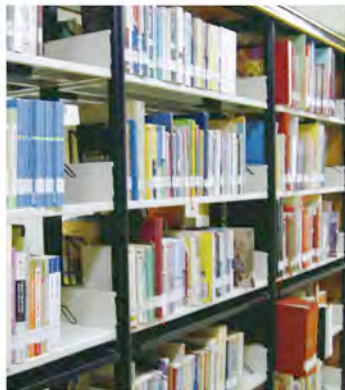
政大綜圖擺放原住民文化圖書的書櫃。