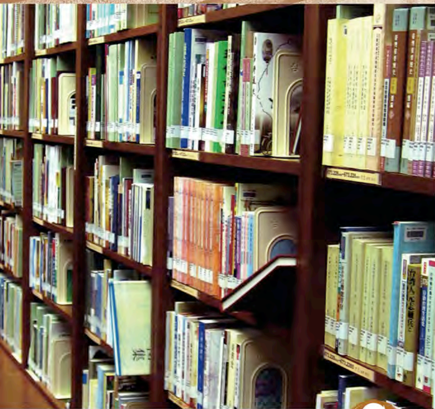
原住民圖書資訊中心的書櫃。

擺脫不了主流社會的價值，把原住民的文學創作、教育問題、政府的調查現況等項目，編排到其他分類裡。這個現象，充分顯現了館方在思考上，發生了衝突：到底是將原住民納入全體體系呢？還是獨立完全的原住民圖書資料庫呢？這個衝突，相信不是只有政大才有，他校圖書館也有類似的問題。