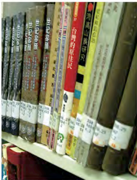
政大原住民文化圖書是從通論到個別民族來陳設。

然而，就算從圖文並茂的文化圖書，到連篇累牘的論文專刊，全都入藏，百無一漏，但是圖書館一旦按照傳統的方式進行編排，還會有其他問題。有鑑於此，筆者特地走訪政大圖書館社會科學院分館，來調查原住民圖書在圖書館裡的狀況。理所當然，原住民相關書籍，大部分被分類在民族誌的項目中。排列的順序，井然有序地從原住民概論，到原住民各族，直到平埔族結束。書籍項目無所不包，舉凡原住民史、原住民民族誌、文學作品、教育問題及現況探討等，都分類在這個項目裡頭。這個看似常見的分類法，就像大拼