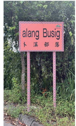
德鹿谷村正名後，平生（Truwan）部落更名為德鹿灣（Truwan）部落；上靜觀（Busig）部落更名為卜溪（Busig）部落。

看，不論是用羅馬符號書寫成的族語或從華語的文字，拼寫的文字不一樣，可以從遷移的歷史了解箇中的意涵。Toda語群源自於南投祖居的都達（Toda）群的傳統領域，曾集居在五個主要的部落，即是Alang Tnbarah, Alang Ayu, Alang Rucaw, Alang Pngpung ni Alang Ruku Daya等部落。歷經幾百年或是1930年發生霧社事件後，已分別移居到台灣東部的花蓮縣卓溪鄉立山村山里部落與本鄉春陽（Snuwil）村、大同村的Drudux（今之碧湖及仁愛國中），以及移居到台灣各縣市的都達（Toda）人。