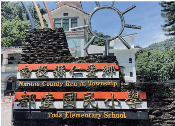
正名後的都達國小及附設幼兒園。