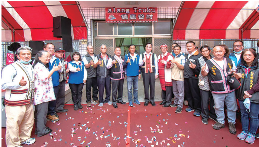
南投縣仁愛鄉合作村，3日起揭牌正式正名為德鹿谷村。（原民會提供，摘自自由時報2021/11/03）。

族德克達雅語群（日語稱：巴蘭群），因轄境佈滿原生種的qhuni banan（苦棟樹）因而得名，日治時期索性將原居民稱作（巴蘭群）。