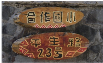
合作國小更名為德鹿谷國民小學後，地址由「平生路23號」更名為「莎都部落1巷23號」。

生（Truwan）部落、靜觀下靜觀（Sadu）部落與上靜觀（Busig）部落三個部落組成的村落。