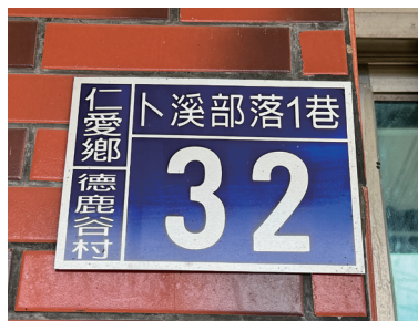
平生路更名為德鹿灣部落1巷和莎都部落1巷，和氣巷改為卜溪部落1巷。

德鹿灣1巷和莎都部落1巷，和氣巷改為卜溪部落1巷。正名後，仁愛鄉戶政事務所亦分別於德鹿灣部落、卜溪部落及莎都部落，現場受理國民身分證及戶口名簿換領，該村村民完全積極換發身分證。