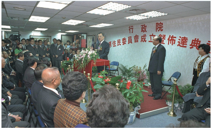
1996年行政院原住民族委員會正式成立。