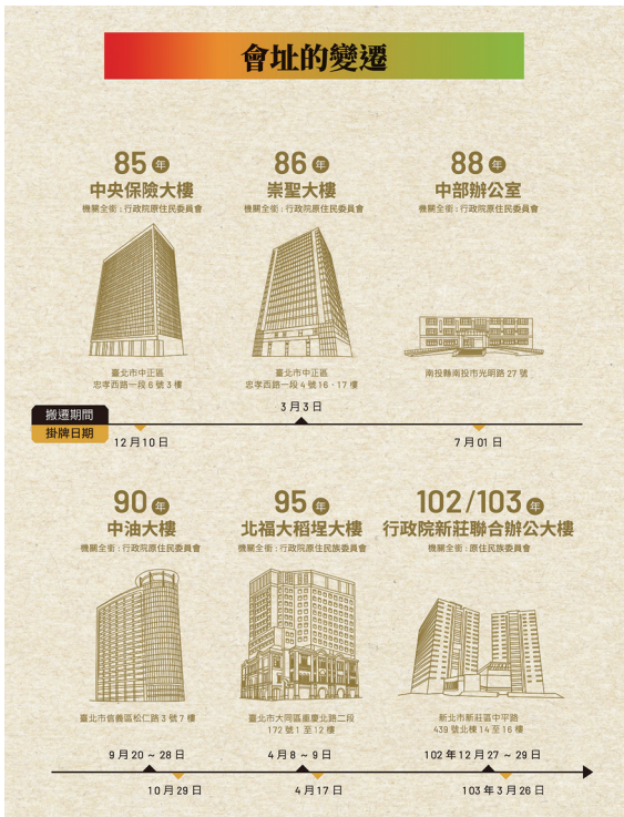
原住民族委員會會址變遷的歷程。

國際法之權利主體地位，就國內法而言，原住民族享有憲法所賦予的平等權，以及2005年制定的原住民族基本法所規定之自治、土地、語言、文化等集體權的權利主體；就國際法而言，原住民族無論是集體或個人，均享有國際人權法的權利，並且享有2007年聯合國原住民族權利宣言所宣示的自決、自治、土地、財產、文化、補償等權利。