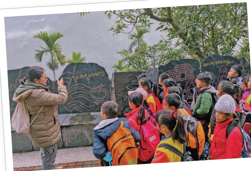
老師帶領學生認識達來部落起源及遷移史。

孩子們從有系統的學習課程中，達到深入在地文化連結的自主學習，透過時間、空間、關係網絡，運用科技深化典藏文化印記，結合各主題全