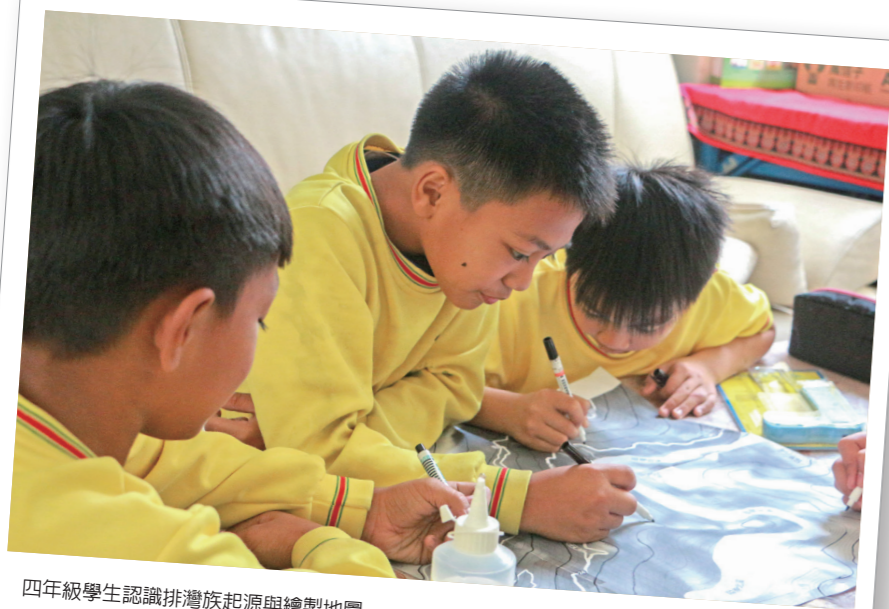
四年級學生認識排灣族起源與繪製地圖。

的民族文化課程，因著在地多元性，以多元文化觀與價值觀，發展出適合孩子的學習路徑與課程，幫助學生更有統整學習並支持孩子不同特質，使土地磨練的孩子走出真實有感知的學習課程，培育學生核心素養的生活實踐力。