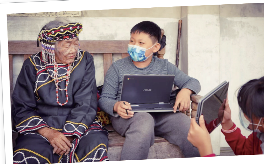
學習田調紀錄阿嬤記憶中的家。

循開墾祭的脈絡分年級回到祖先居住的老部落。低年級是兩天一夜的課程回到鄒族和社大社，中年級是三天兩夜的課程回到布農族卓社群補藤社，高年級是四天三夜回到布農族郡群無雙部落、瑪西塔隆部落。孩子們越走越遠，心卻越來越靠近。今年我們再次帶中年級孩子踏上回補藤的路，學校有超過20個夥伴要參與事前的場勘，這樣的熱忱是因為理解專業的價值，對原住民教師而言，更是一種肯認、當責的體現，對久美孩子而言是愛與榜樣。