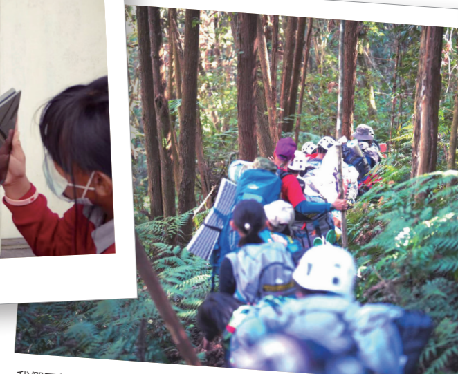
我們要把補藤的風（氣息）帶回久美。

模糊，也讓學生因角色認同混淆而影響學習，致使學習一直存在著缺乏脈絡化、情境化與意義化的問題。我們透過深度理解板曆內蘊的原民文化智慧，再依據專業認知、文化素養及所蒐集之文獻及調查資料，與部落耆老仕紳訪談之後，尊重家長期待與學生的發展需求，發展出久美多