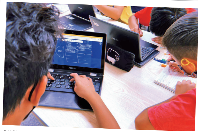
收集辯論會的資料，擬定辯論策略。

先與大自然友好平衡的關係，所以最重要的價值是與大自然友好，分享一點給小鳥，但拜託小鳥讓我們有足夠的量足以在後續的祭典和課程中運用。在家族會議後孩子們開始行動，有的家族用鄒和布農傳統的趕鳥器製造聲響下逐客令，有的家族用回收的寶特瓶和光碟片，利用太陽的反射嚇走小鳥，還有規劃用資訊課學到的程式設計監測感應然後用聲光雙效讓小鳥知道我們的厲害。或者使用友善的圍網將小鳥拒之門外。高年級還有一場辯論會，辯論主題「可以用彈弓驅離小鳥嗎？」這些想法與行動，不正是SDGs的實踐了嗎？我們的祖先原本就是與大自然共存共