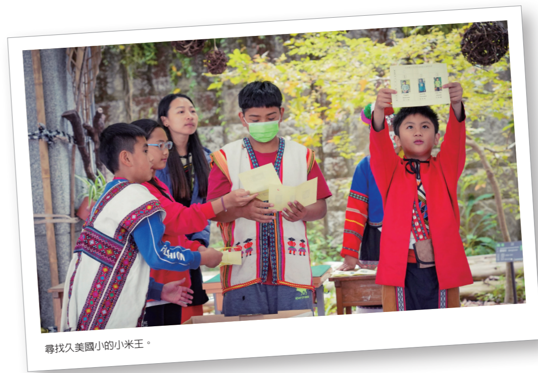
尋找久美國小的小米王。

己，把養分讓給其他小米，我認為他配得這個權杖，我祝福他能夠強壯起來，然後繼續守護小米們。」在家族領袖選舉時，有一個孩子直直地舉起手自告奮勇地說：「我覺得大家也可以考慮我當領袖，我成績沒有很好但我很愛工作，而且我沒有參加很多比賽，我有很多時間可以做事。」這是一個多元價值的體現和公民行為的實踐。