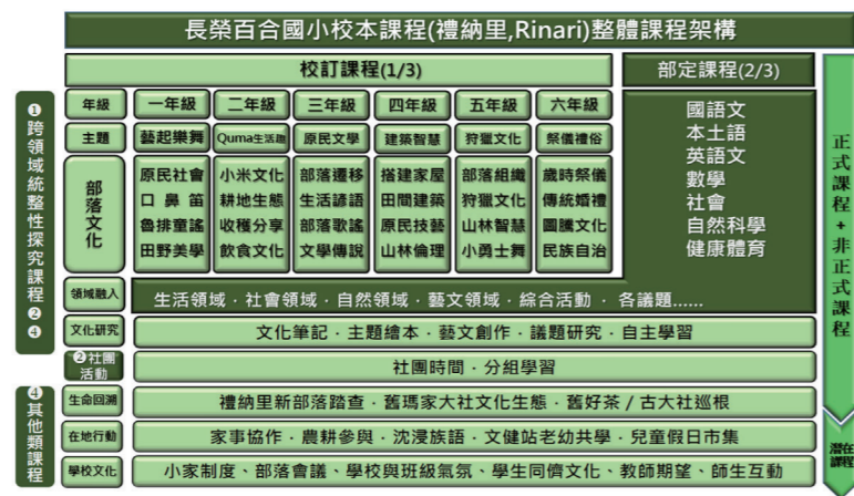
本校的整體課程架構設計。

在實驗教育三法通過後，本校於105學年成為第一波原住民族實驗教育辦理學校。基於學校課程發展與實踐的基礎，與原住民族實驗教育的課程規範，並考量隨即上路的108課綱，課程設計參照 Banks 所提出的多元文化課程發展，