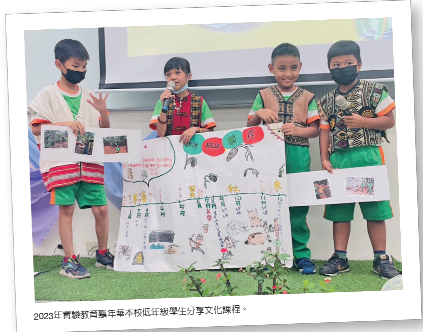
2023年實驗教育嘉年華本校低年級學生分享文化課程。

校訂課程是以文化為主題的跨領域統整性探究課程。各年級的主題分別為：藝起樂舞、quma生活、原民文學、建築智慧、狩獵文化、祭儀禮俗為主題，各主題有4個單元。校訂課程的節數占總節數的三分之一，分別為：部落文化、領域融入文化、文化研