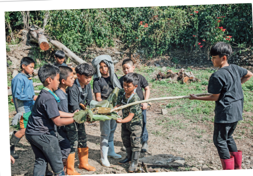
學生在舊好茶部落進行capi (勇士報信)。

因應文化課程的需求，部落耆老在課程中扮演重要角色，與班群夥伴對話，一同萃取族群文化的課程內涵，據此啟發學習者對其背後的深層文