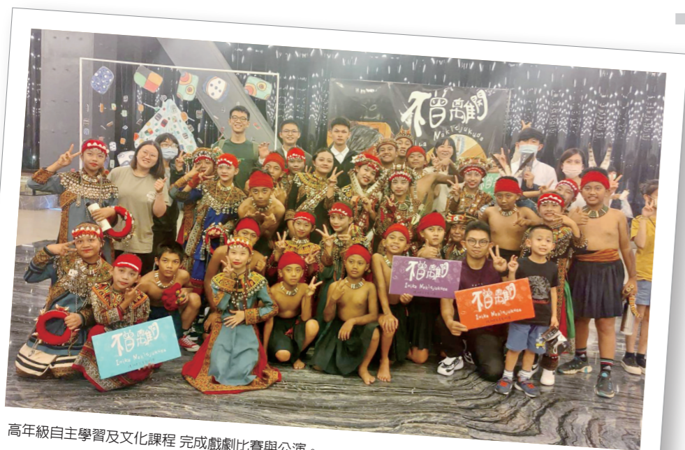
高年級自主學習及文化課程 完成戲劇比賽與公演。

因應文化課程的需求，部落耆老在課程中扮演重要角色，與班群夥伴對話，一同萃取族群文化的課程內涵。