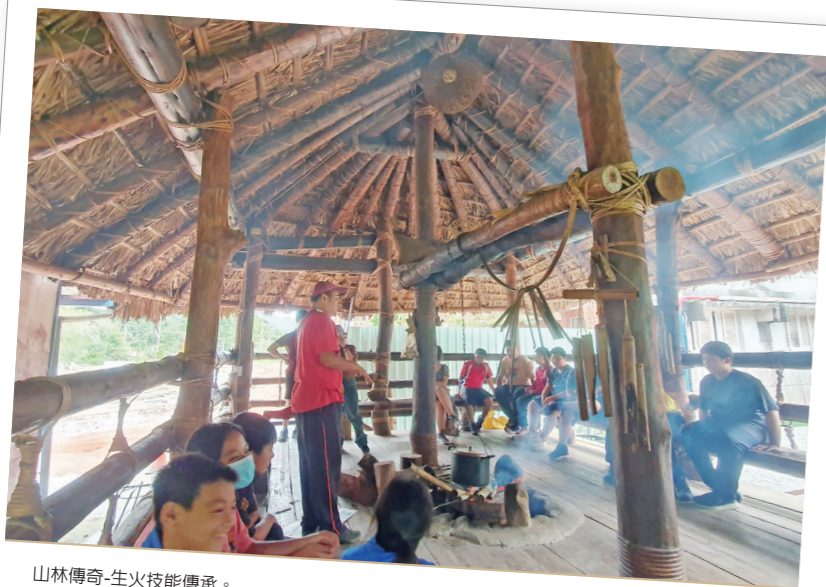
山林傳奇-生火技能傳承。

本校課程分為6大主題：焚壘生活、技藝之美、山林傳奇、美麗的hosa、藝術樂舞、Cou文學。以傳統生活為本位、鄒族文化為核心、傳統技藝為體驗三大主