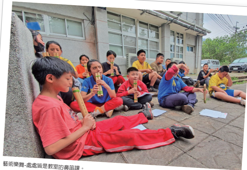
藝術樂舞-處處皆是教室的鼻笛課。

一路走到現在，上課的場地逐漸從班級教室走到校園、部落，甚至整個阿里山，很幸運的是，校園擁有另一間教室：tataka (這是一棟一直被大家誤會成kuba的高級涼亭)，從四周都是牆壁的班級教室走入涼亭上課，不論是孩子們或是老師，總感覺上課的心離文化又更近了一點。從一開始教師們在黑板、投影幕前侃侃而談的講述，走到現在給予孩子們更多的發揮空間，他們耳聽八方、眼觀四方、書寫筆記、相互分享、互相學習，