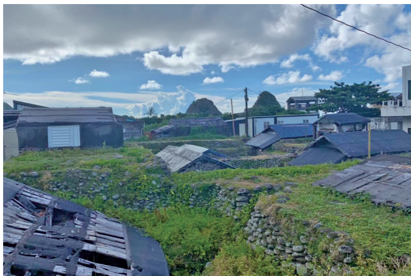
朗島舊部落家屋群。

在傳統的部落土地使用中，主要是族人的傳統家屋的土地使用，早期傳統家屋通常會在部落的中央且向外擴散，而家屋的組成是由主屋（Vahay）也就是最常聽到的地下屋，工作房（Makarang）也稱高屋以及涼亭（Tagakal）三個建物來組成，主屋（Vahay）是族人主要生活起居和烹煮食物的地方，工作房（Makarang）則是白天工作使用的空間，也可以是在新建新的家屋時暫時提供居住的地方，同時也是落成時招待賓客的空間；涼亭（Tagakal）是族人休息、手作、社交以及夏日時族人可以睡眠過夜的地方。除了上述三個建築之外還會有前庭，前庭上也有靠背石可供族人觀海、社交以及意見交流討論的場域，早期並無高大的建物也因為地勢緩升