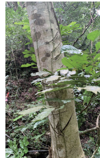
近山林園上被做記號的樹木。