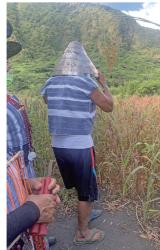
因部落祭儀作物需求於部落公共旱田種植小米。

許多人想到達悟族可能第一個想到的就是海洋文化，以及海洋對於達悟族的重要性，但是山林對達悟族來說也是相當重要的文化實踐場域，也是任何建物無論是家屋、日用器具還是拼板舟木材獲取的地方，而在山林的部分可以分成三個區域，分別是近山林園 (Tokoun) 和遠山森林 (Kahasan) (林嘉男2021) 以及溪流 (Ayo) 和水渠。