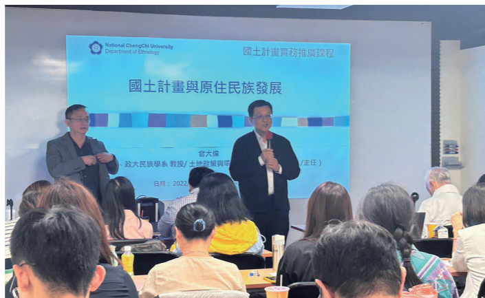
開設國土計畫實務推廣課程。