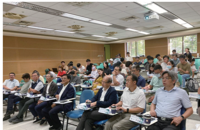
建立北區國土規劃協同教學平台。