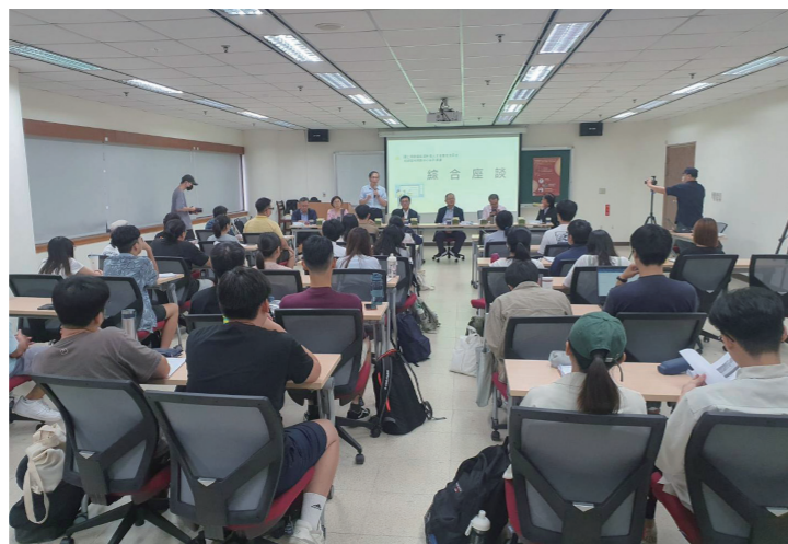
補助辦理開設國土計畫相關課程。

全新的國土計畫法制納入新的空間規劃觀念及策略工具，以期解決存在已久的土地使用管理問題。首先，藉由全國國土計畫與直轄市、縣（市）國土計畫重新建構國土空間管理體系，確立相關計畫皆應遵循國土計畫空間規劃之優位性；其次，按照自然環境條件、海域資源管理、糧食自給率目標及城鄉發展願景等將國土重新劃分為「國土保育地區」、「海洋資源地區」、「農業發展地區」、「城鄉發展地區」之四大功能分區及其分類，並藉此因地制宜地指導各土地